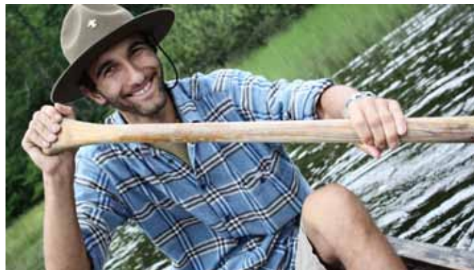
Divočáci v Kavárně – výstava „Střípky ze skautského tábora“