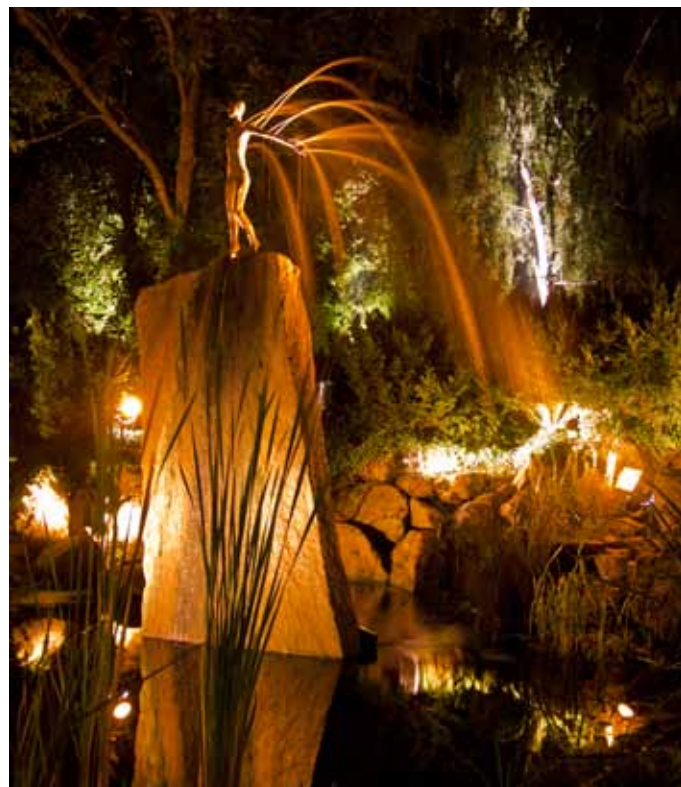
Socha Vzlet od Kurta Gebauera na nádvoří fy Podzimka a synové

Firma získala řadu ocenění za realizované stavby, což je důkazem kvality a originality. Ale nebývá pravidlem, a už vůbec ne v dnešní době, aby se kladl tak velký důraz i na estetický prvek vlastních provozních staveb, hal či skladů. V úspěchané současnosti se staví hlavně rychle, funkčně a jednoduše. Pomíjivost a univerzálnost je základním rysem většiny firemních hal a obchodů. Nedbá se příliš na originalitu a nadčasovost. O to více udivují promyšlené, funkční a přitom velmi estetické prostory u Podzimků. Není se čemu divit, vždyť například pod realizací ve Vaňovské ulici je podepsaný sochař, prof. Kurt Gebauer a špičkoví soudobí architekti ze společnosti D3A.