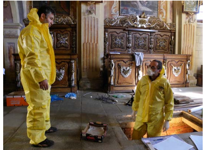
Vstup do hrobky