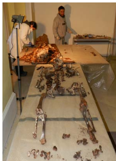
Východní pohřební komora a antropologický výzkum Andreje Shbata