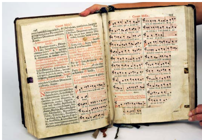
Missale romanum (římský misál), liturgická kniha z roku 1740. Latinským rukopisným zápisem na titulní straně svazku je doloženo používání misálu v zámecké kapli sv. Jana Nepomuckého v Plandrech u Jihlavy.

V zámecké knihovně byly soustředěny knihy s tematikou církevní, almanachy, ročenky, kalendáře, sbírky básní, životopisy, různé praktické příručky, knihy historické, s tematikou práva, historie