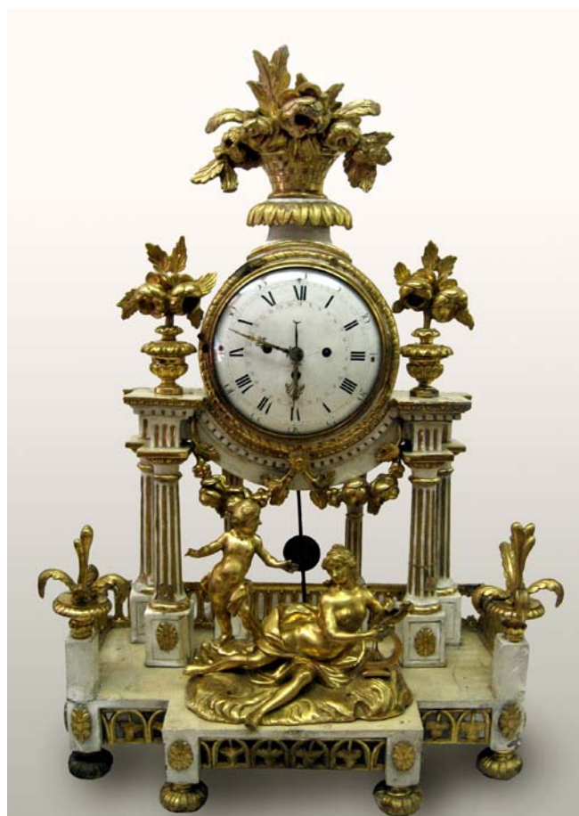
Hodiny z doby kolem roku 1790, součást sbírky hodin MVJ