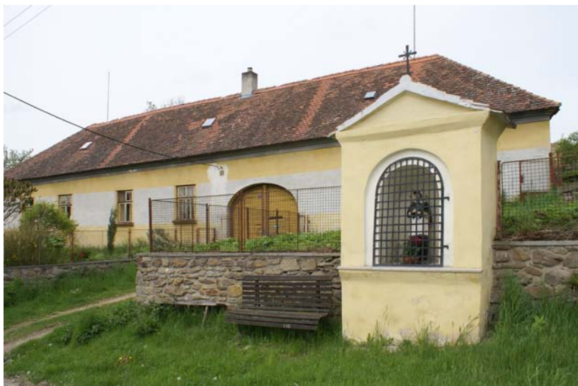
Pohled na statek s kapličkou, obec Dyjička, 2012

V roce 2013 Muzeum Vysočiny v Jihlavě plnilo již čtvrtým - závěrečným rokem grant Ministerstva kultury ČR v rámci dotačního programu Podpora tradiční lidové kultury – kategorie A, který každoročně vyhlašuje odbor regionální a národnostní kultury MK ČR. Název projektu jihlavského muzea zní Záchranný výzkum lidové architektury na okrese Jihlava.