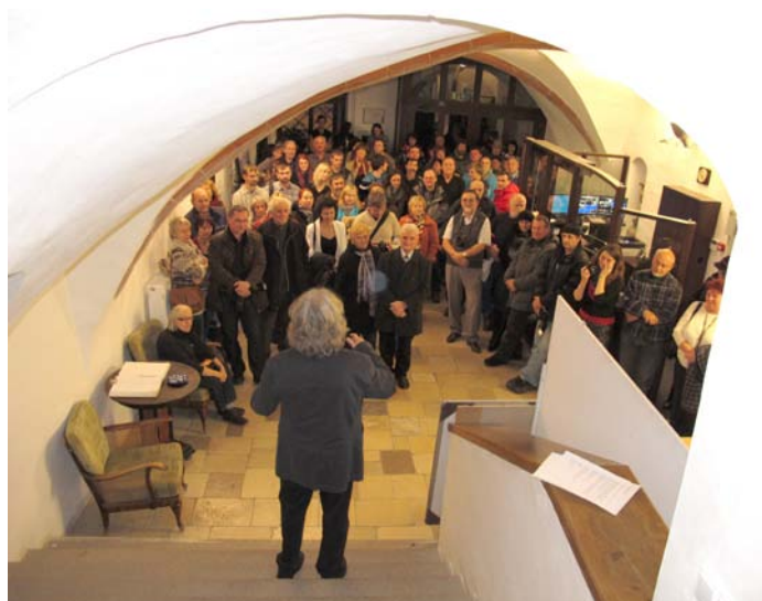
Z vernisáže výstavy Photographia Natura 2013