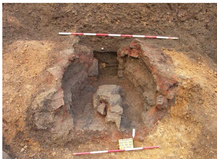
Hrnčířská pec z Jihlavy, Křížové ulice č. 14. Foto: David Zimola – MVJ, 2008