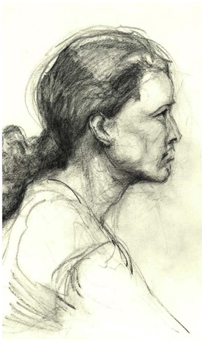
Autor portrétu Petr Kolros