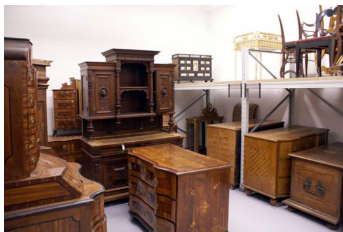
Pohled do depozitáře nábytku