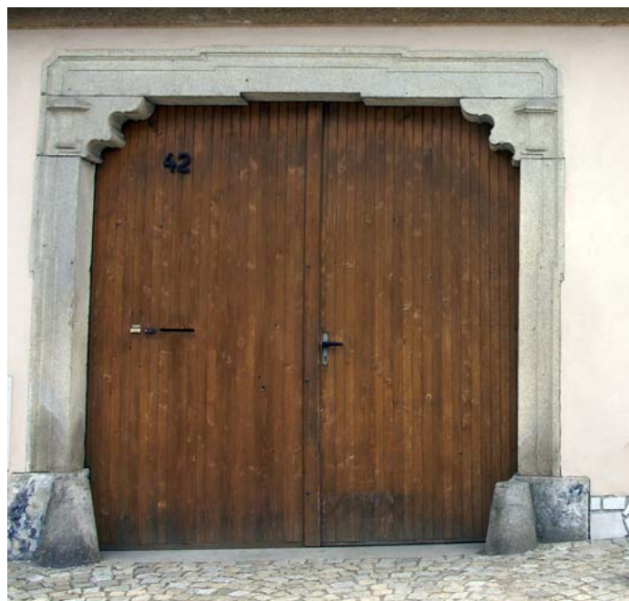
Ostění u vchodových vrat u domu Mrákotín, 2013

V terénu jsme se zaměřovali na dokumentaci vybraných vesnických stavení, včetně detailů, v případě ochoty některých obyvatel i interiérů, dále na hospodářské objekty, typy návsi a další zajímavosti, charakterizující život vesnic okresu. Průměrně v každé obci šlo o dokumentaci 10–15 stavení s cca 5-8 záběry na jeden objekt. Součástí výzkumu byla i dokumentace drobné sakrální architektury v obcích i okolí. Další částí zmíněného grantu bylo vedle fotografické dokumentace i zhotovování kreseb vybraných reprezentativních objektů a detailů lidové architektury od několika autorů. V současné době je jich zhotoveno kolem 150 kusů. Dále bylo pořízeno prozatím 13 modelů stavení i drobné sakrální architektury /např. modely z obcí Dyjice, Myslůvka, Dobronín, Salavice apod./.