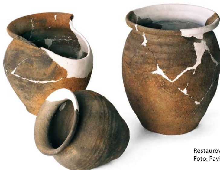
Restaurované keramické hrnce z jihlavské pece.