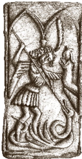
Obr. 3: Telč – zámek, čelní stěna komorového kachle s motivem archanděla Michaela zabíjejícího draka, kresba E. Šámalová-Bílková, úprava M. Horáková.