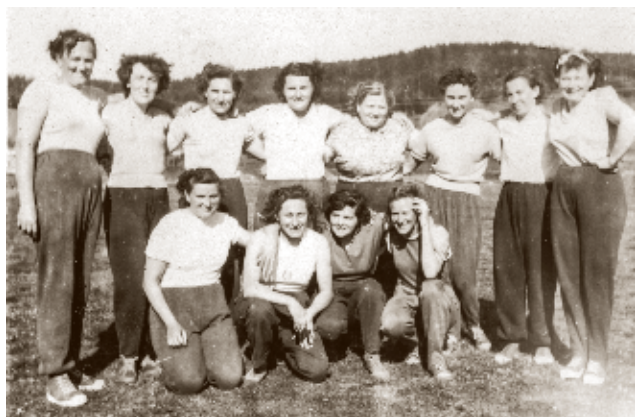
fotbalistky v Kostelci