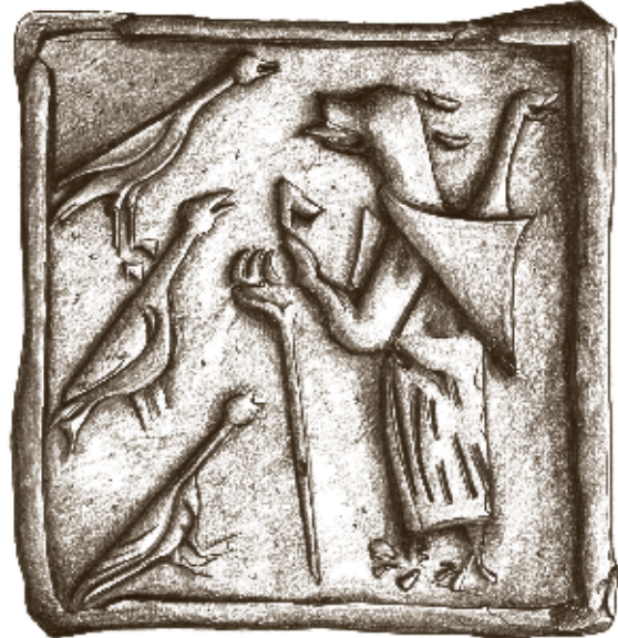
Obr. 2: Jihlava – Dominikánská ulice, komorový kachel s motivem vlka kázajícího husám, kresba E. Šámalová-Bílková, úprava M. Horáková.