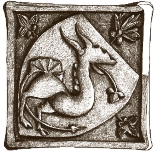
Obr. 1: Jihlava – Dominikánská ulice, komorový kachel s motivem draka na štítu, kresba E. Šámalová-Bílková, úprava M. Horáková.

Výkop pro kanalizaci, který na jaře roku 1991 protal středověkou odpadní jímkou (obr. 4), vynesl na světlo boží kromě draka i další unikátní poklad. Jednalo se o podobný komorový kachel malého formátu s poměrně vzácným vyobrazením falešného mnicha v podobě vlka, který káže husám nebo jeřábům symbolizujícím důvěřivé stádo věřících (obr. 2). Kromě jihlavského nálezů je znám pravděpodobně jen jeden podobný výjev na kachli, který pochází z archeologického výzkumu sklípku pod jižním křídlem Pražského hradu v roce 1938. Na základě ikonologického rozboru našeho předního medievisty Zdeňka Smetánky můžeme vyobrazení interpretovat jako falešného proroka v mnišské kutně, který káže bludy drůbežímu stádu a tím mu přeneseně krade duši (husa v kápi). Na rozdíl od moderní doby byl vlk běžnou součástí středověké fauny a také součástí velmi silně negativně vnímanou. Vlk totiž vzbuzuje obavy, loupe, vraždí pokojné domácí zvířectvo a přeneseně snad i svádí na scestí v duchovním smyslu slova. Vzhledem k místu nálezů v blízkosti bývalého dominikánského kláštera v Křížové ulici je zajímavý jeden příklad uváděný v husitském manifestu z roku 1431, kdy je nejmenovaný dominikánský inkvizitor charakterizován slovy „dělá to jako vlk“. Motiv má původ v Matoušově