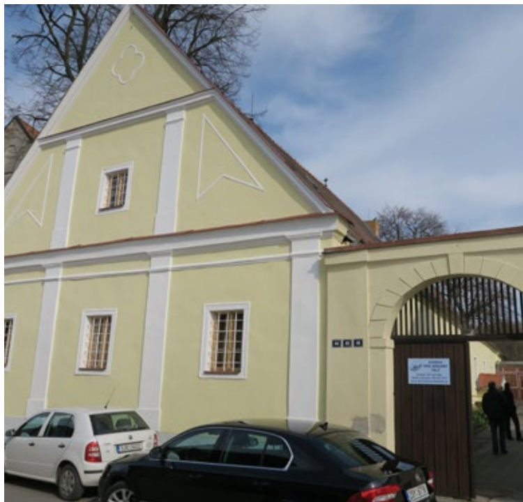
Domov seniorů.

Telčská pobočka Muzea Vysočiny Jihlava patří k nejstarším muzeím na Moravě; již dlouhou dobu sídlí v prostorách telčského zámku. Národní památkový ústav, který je majitelem objektu, se však rozhodl k rozsáhlé rekonstrukci zámku a pro prostory, v kterých momentálně muzeum sídlí, plánuje vlastní – nové – využití. Muzeum tak musí do konce roku 2018 najít nové sídlo, které by mu umožnilo plnit všechny funkce, které muzeum podle zákona i podle logiky a očekávání návštěvníků, plnit musí.