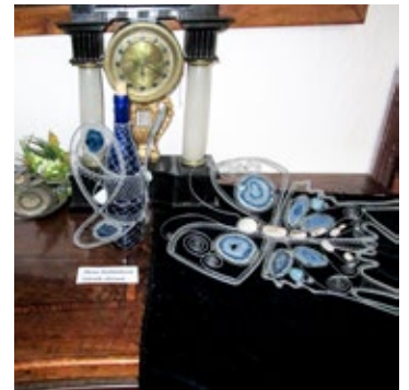
Z výstavy Drátění v Telči i v Jihlavě.