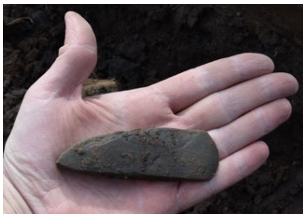
Obr. 2. Kamenná broušená sekerka vyzvednutá z jámy po více jak 6 tisíci letech.