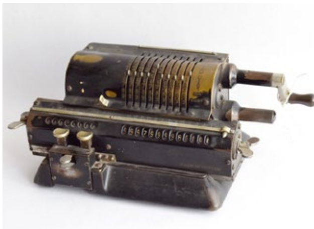
Kalkulátor, inventární číslo: Ji-11/B/155, základna: 19,5 cm x 14 cm, výška: 13 cm.