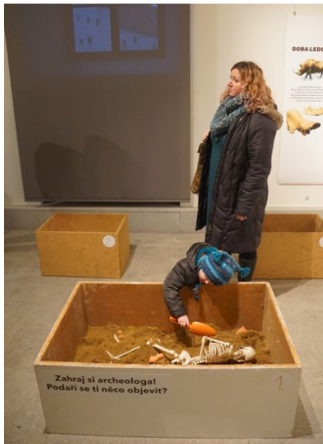
Obr. 5: Dětský koutek s „pískovištěm“