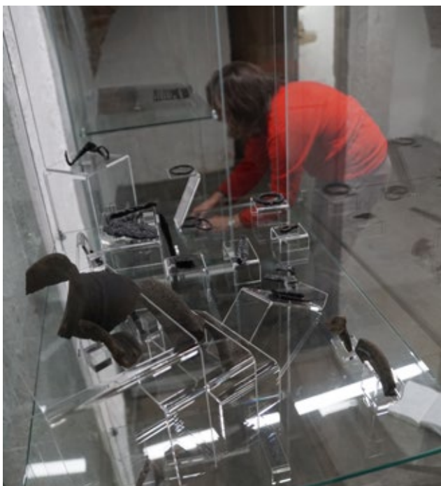
Obr. 7: Instalace archeologických nálezů do vitrín.