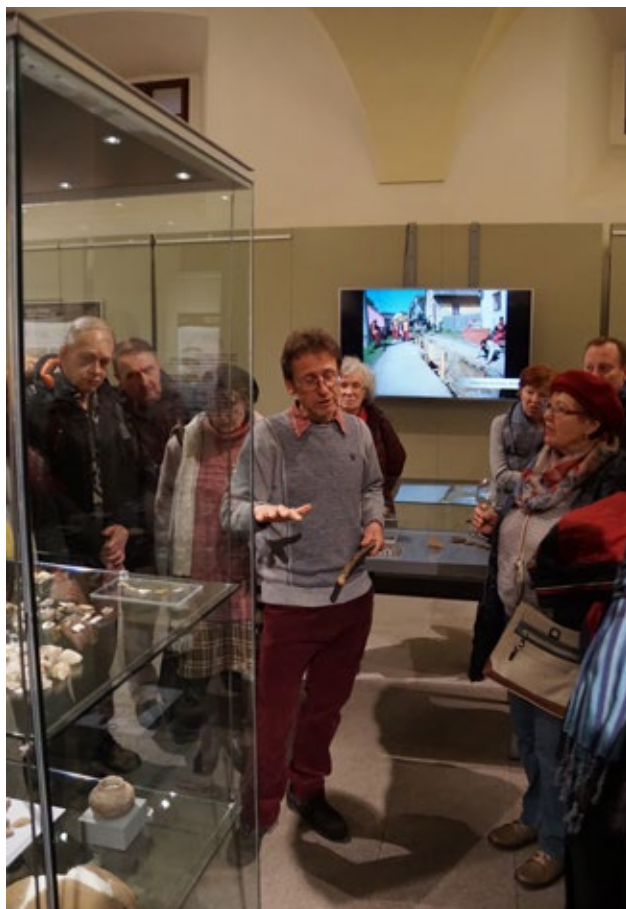
Obr. 6: Obrazovka s prezentací archeologických lokalit na Třebíčsku.