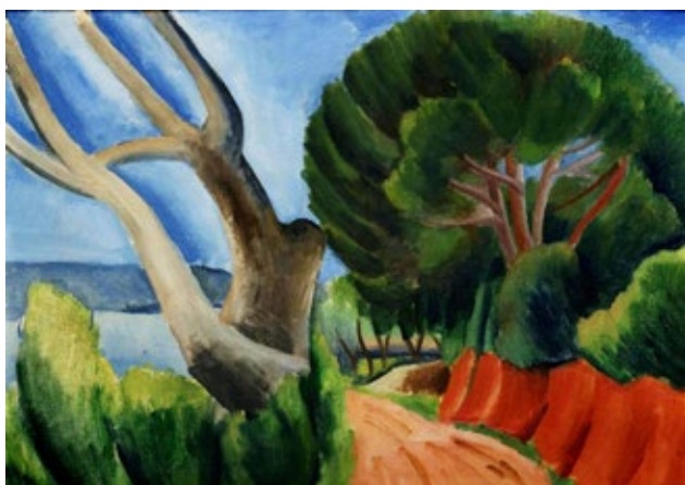
Bedřich Piskač, Cesta s korkovým dubem, 1928