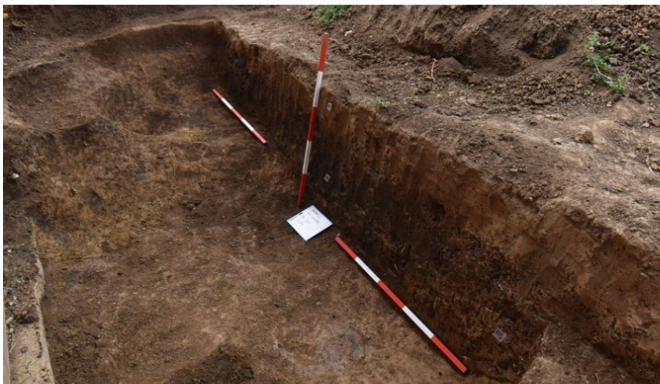
Obr. 3. Část zkoumané jámy sloužící v době kamenné k těžbě hlíny.