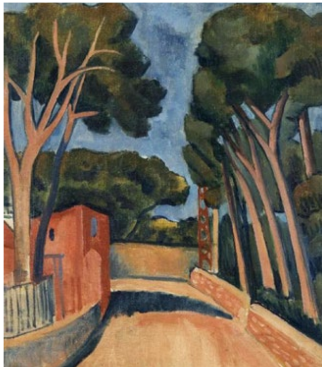
Bedřich Piskač, Cesta do Antibes 1929