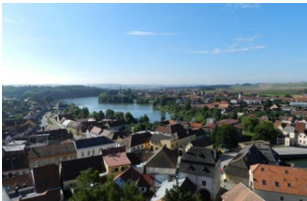
Obr. 3: Pohled na Staroměstský rybník z věže sv. Ducha.