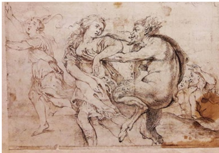
Satyrové honí skupinu nymf – kresba, Polsko, následovník P. P. Rubense

ženoucího se za ženskou postavou (dříve také označováno a v průvodcovských textech uváděno jako Satyr a bakchantka ). Dlouhou dobu nám vrtalo hlavou, které dílo slavného umělce bylo předlohou pro tuto historickou kopii (byť její datace rozhodně nejde až do 17. století). Problém je, že Rubens (spolu se svou rozsáhlou dílnou) vytvořil na 10 000 uměleckých děl, jako jsou olejomalby, kresby, nástěnné koberce, apod. Bylo tedy vůbec reálné najít správný vzor, když jsme věděli, že se zřejmě nejedná o žádné z nejslavnějších děl publikované v každé učebnici dějin umění? Bylo! Podařilo se totiž dohledat, že pravděpodobným předobrazem olejomalby visící na Roštejně je kresba uložená v Národním muzeu v polské Varšavě či nějaký nám dosud neznámý obraz, ke kterému se ale kresba bezpochyby vztahuje. Kresba nese označení Satyrové honí