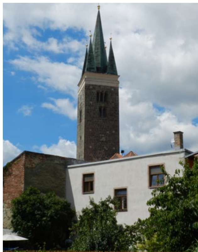
Obr. 2: Věž sv. Ducha.