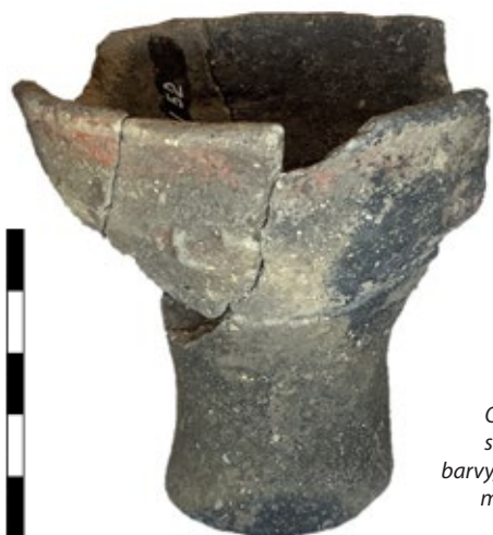
Obr. 1. Miska na nožce se zbytky červenožluté barvy, kultura s moravskou malovanou keramikou.