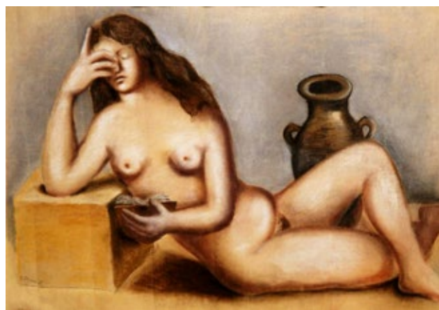
Bedřich Piskač, Akt, 1924