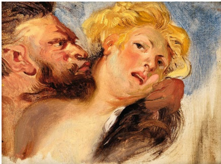
Satyr a nymfa – hrad Roštejn

Interiéry hradu Roštejn zdobí kromě jiného několik desítek olejomalb, jejichž velkou část mohou návštěvníci vidět v prostoru obrazárny na začátku návštěvnické trasy A. Zejména jedno dílo vždy upoutá pozornost malých i velkých a nejedná se přitom ani o obraz nejstarší, ani umělecky nejhodnotnější. Zkrátka a jednoduše zaujme především svým námětem. Jedná se o dílo ve stylu známého vlámského malíře 17. století Petra Pavla Rubense (1577–1640) a zobrazuje vášnivého satyra