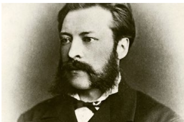
W. T. Odhner (*1845 Švédsko, †1905 Petrohrad, Rusko), vynálezce prvního masově vyráběného mechanického kalkulátoru