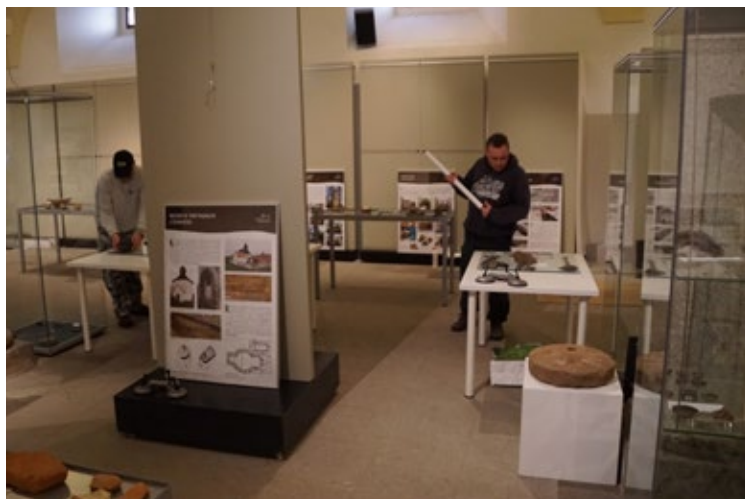
Obr. 8: Instalace výstavy v únoru 2023.