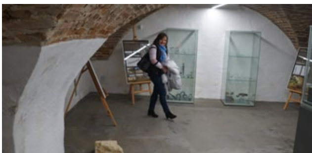
Obr. 5: Vitríny pořízené z Evropského fondu pro regionální rozvoj.