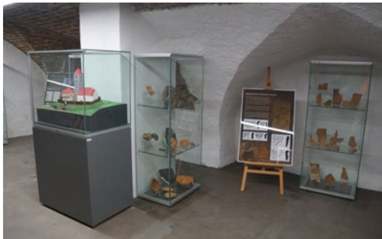
Obr. 1: Pohled do expozice.

Text a foto David Zimola (kurátor expozice)