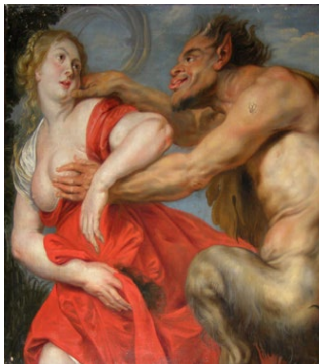
Satyr a nymfa – E. Delacroix