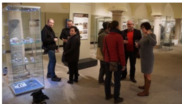
Obr. 2: Vernisáž výstavy 2. 3. 2023.