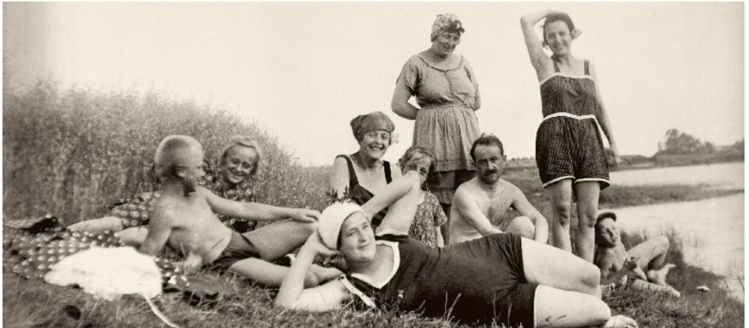
Zašlá sláva jihlavských plováren - Fotoalbum 12. 6. – 30. 8. 2015, http://muzeum.ji.cz