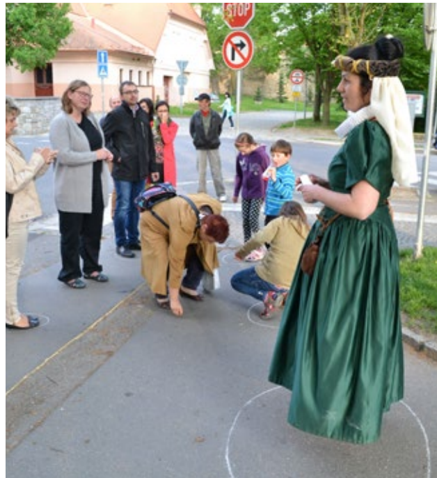
Z muzejní a galerijní noci 2015