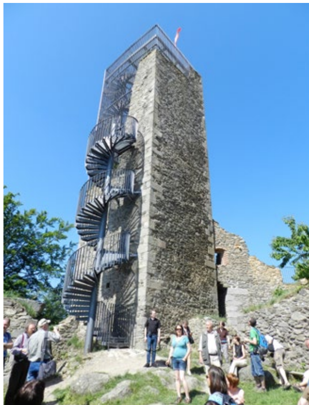
Kamenná věž a její úprava na rozhlednu na hradě Orlík nad Humpolcem.