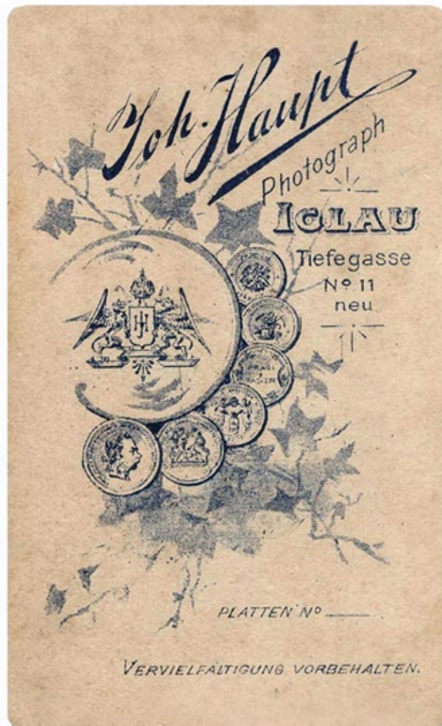
Reklamní vizitka na zadní straně fotografie, kolem r. 1900