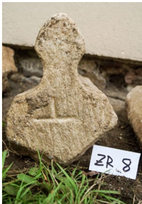
Mramorové žebro ze středověké klenby s kamenickou značkou.