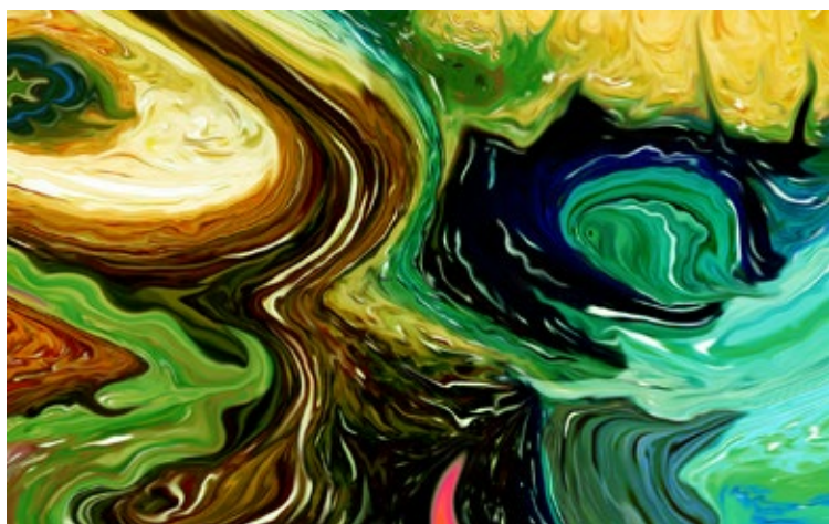
Panta rhei. Ilustrace: Pavel Bezděčka – MVJ

Že je náš svět velmi nestálý, proměnlivý a v neustálém pohybu, je skutečnost, kterou můžeme pozorovat všichni a stále. Můžeme se navzájem lišit v tom, jak budeme vysvětlovat příčinu těchto změn, jaké změny budeme vidět a můžeme se lišit i v tom, jaký v tom pohybu a změnách budeme spatřovat smysl (budeme-li tedy tomu všemu „hemžení“ vůbec nějaký smysl přisuzovat).