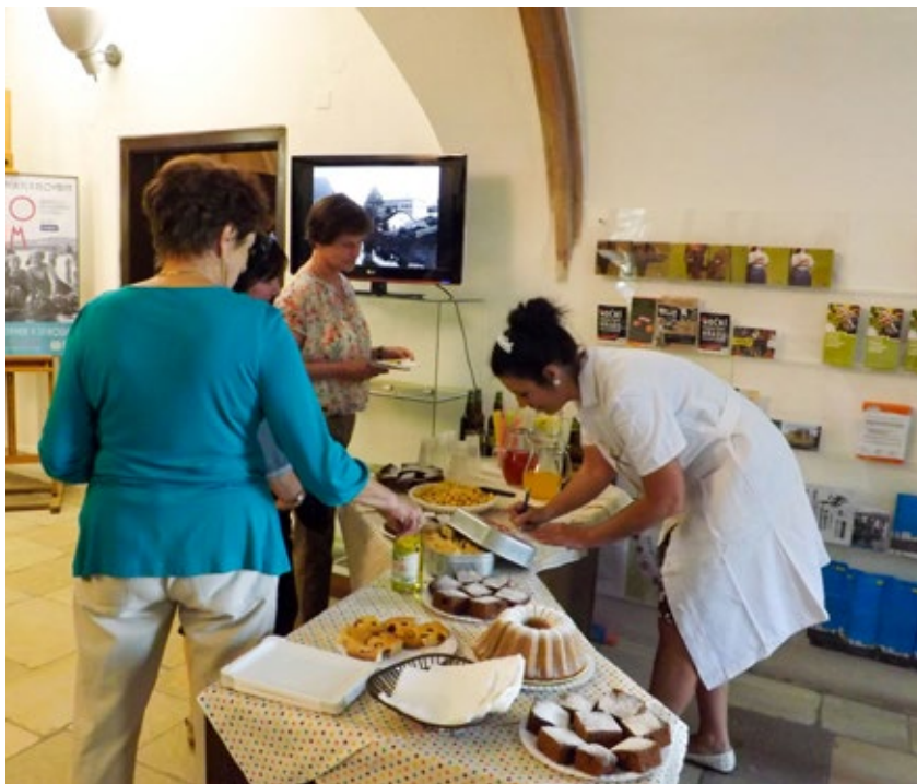
Z vernisáže výstavy Zašlá sláva jihlavských plováren – Fotoalbum.