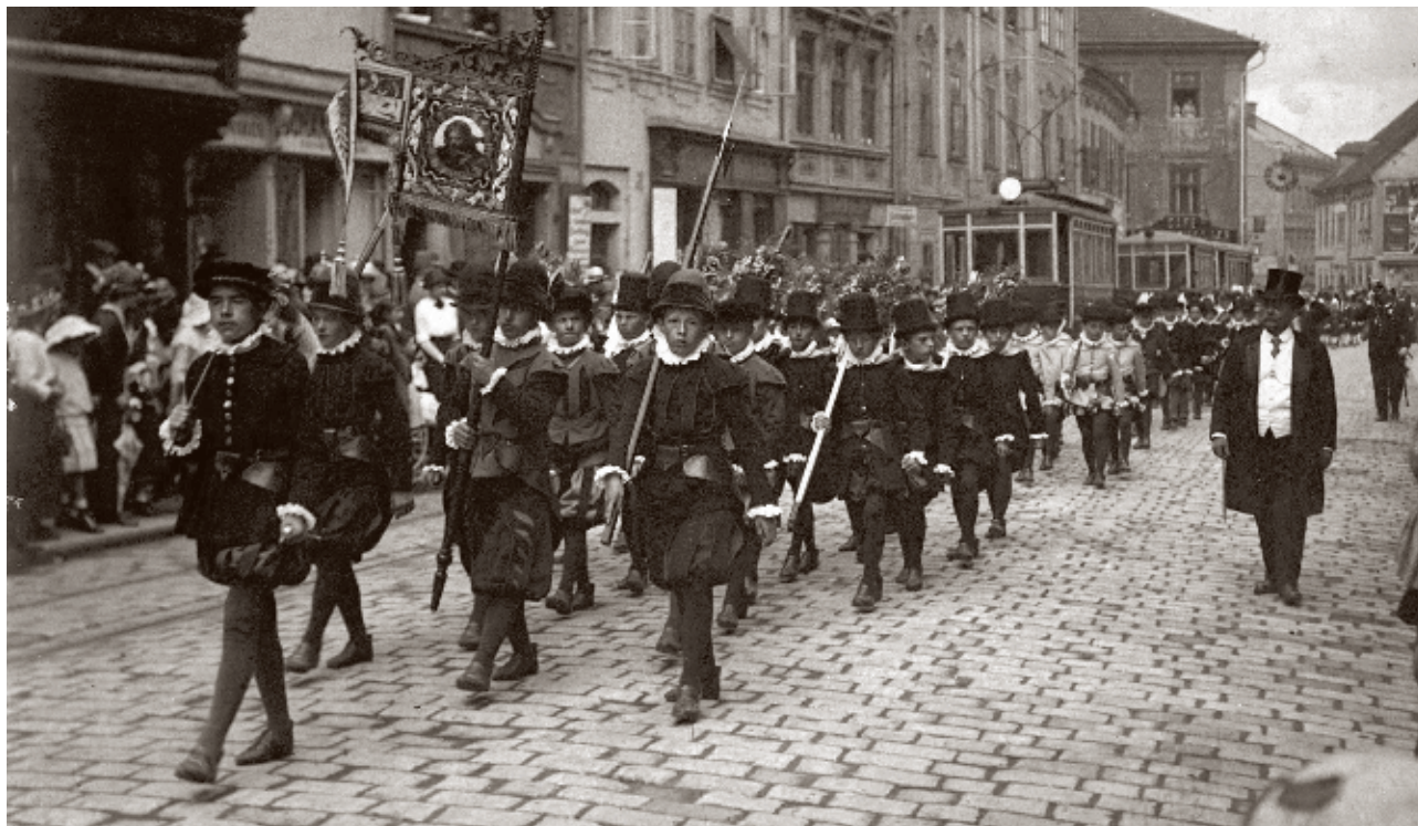
Haviřský průvod, kolem r. 1920