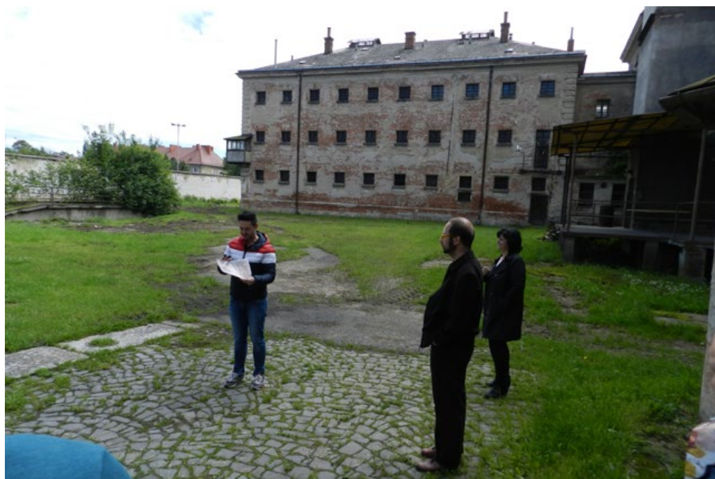
Obr. 2: Uherské Hradiště – areál bývalé věznice.