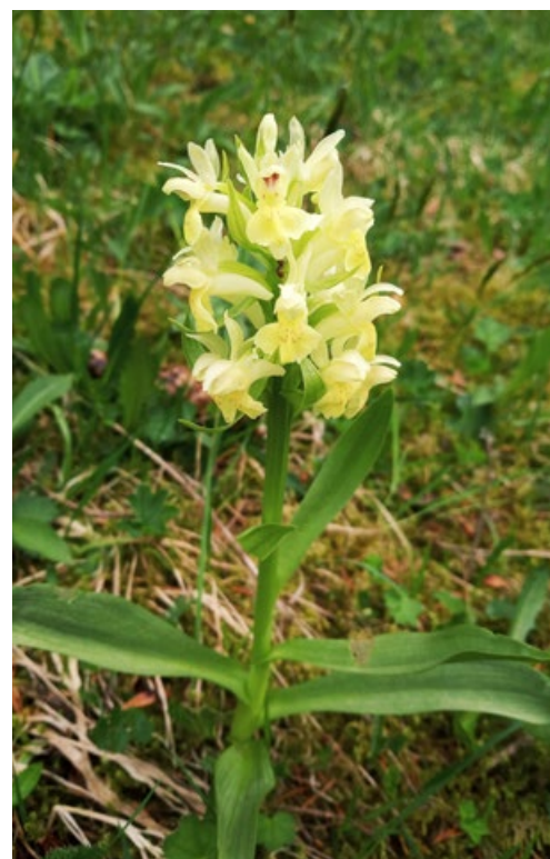
Foto 2: Žlutokvětá forma vstavače bezového ( Dactylorhiza sambucina )