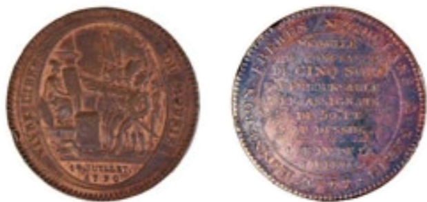
Mince v hodnotě 5 solů, avers a revers.

Francouzská vláda byla tehdy nucena řešit i otázku ražby měnových prostředků. V roce 1792 byla uvedena do života tato mince v nominální hodnotě 5 solů, jež platila pouze do roku 1793. Mincí vydala soukromá banka bratrů Monneronů ( Monneron frères négociants ), jež k tomu předchozího roku získala oprávnění. Jednalo se o nouzovou měděnou minci, raženou v Anglii v dílně Soho Matthewa Boultona v Birminghamu s pomocí Wattova parního stroje. Banka však kvůli nesmírně těžké finanční situaci v březnu 1792 zkrachovala a vyhláška ze 3. září 1792 zakázala výrobu soukromých měn úplně. Nouzové mince tohoto druhu nicméně zůstávaly v oběhu až do konce roku 1793. Soukromé ražbě nouzových mincí se v této době ovšem nevěnovala pouze banka bratrů Monneronů, ale i některé další instituce, a to i ve stříbře.