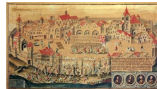
Marzyho verze události přenesená na papír v roce 1790