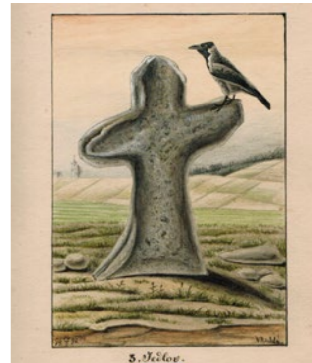
Ukázka malovaných stránek z manuskriptů Viléma Richlého.