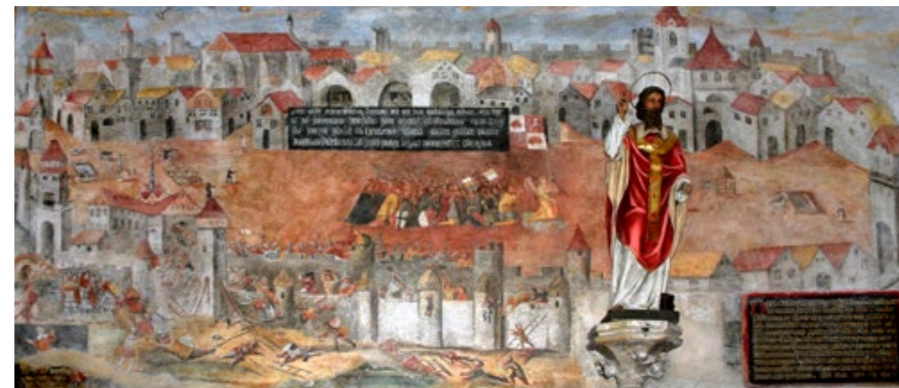
Nástěnná freska Přepadení Jihlavy v roce 1402