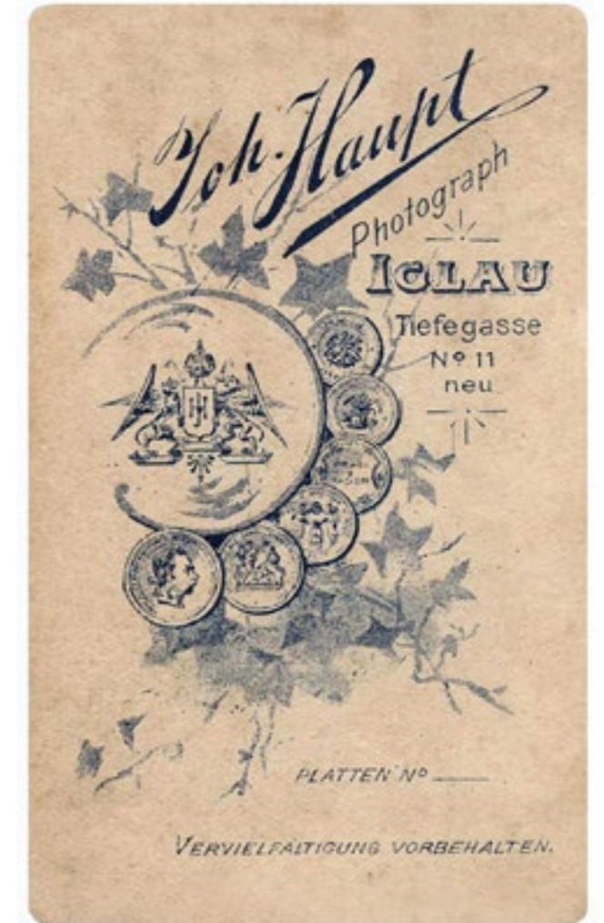
Reklamní vizitka na zadní straně fotografie, kolem r. 1900