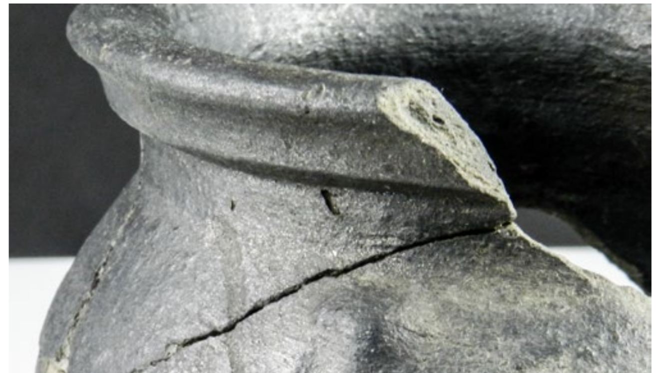
Jihlava – zásobnicové hrnce.