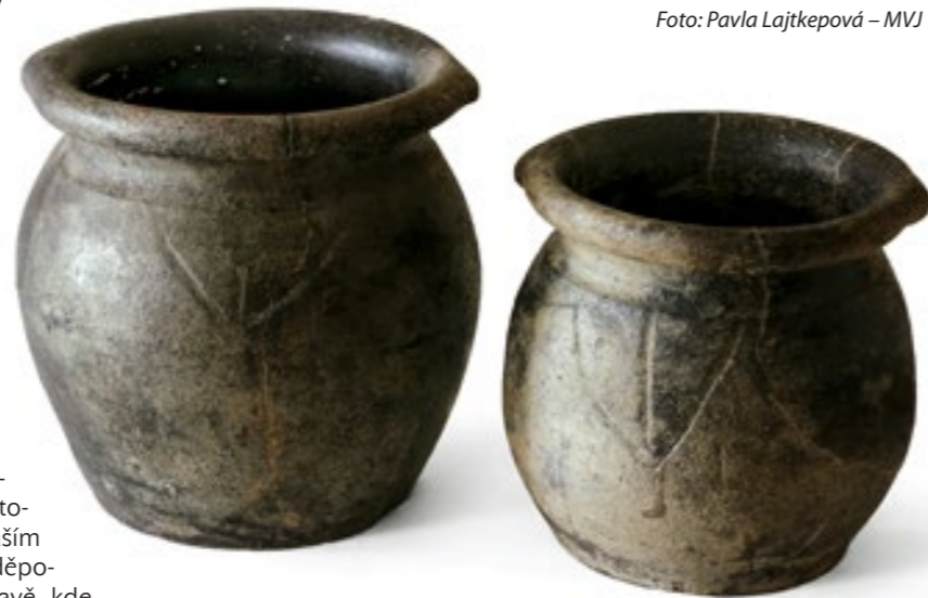
Jihlava – zásobnicové hrnce.

Největší počet rytých ornamentů na celých nádobách byl nalezen v jihlavských odpadních jímkách během záchranných výzkumů v centru města v 70. až 90. letech 20. století, několik exemplářů pochází z výzkumu kaple sv. Josefa v Mirošově u Jihlavy a další podobně vyzdobené kusy odkryli archeologové při výzkumu dolního paláce zříceniny hradu Rokštejna. Zvláště rokštejnská keramika je nápadně podobná té jihlavské. Většina ornamentů pocházejících z obou lokalit má obě krajní linie