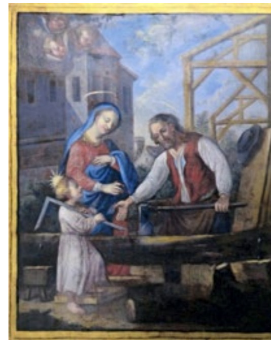
Praporec cechu tesařů – Svatá rodina – stav po restaurování. Dole v průběhu vyrovnávání.