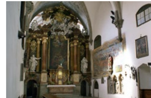
Presbytář kostela Nanebevzetí Panny Marie s freskou Přepadení Jihlavy v roce 1402