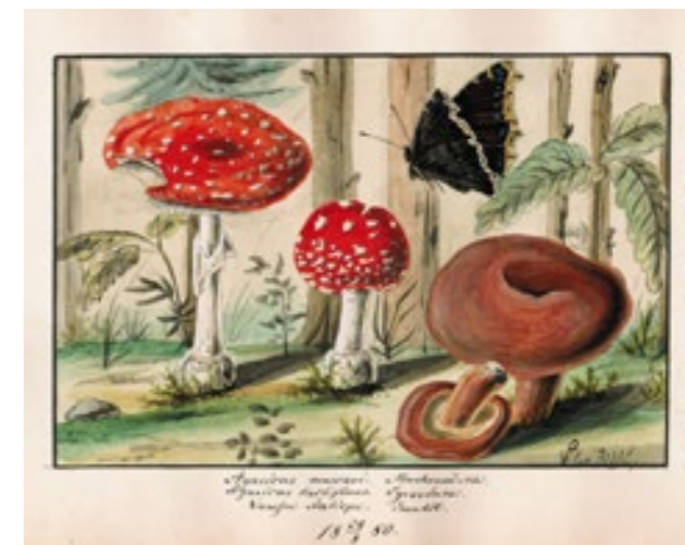
Ukázka malovaných stránek z manuskriptů Viléma Richlého.