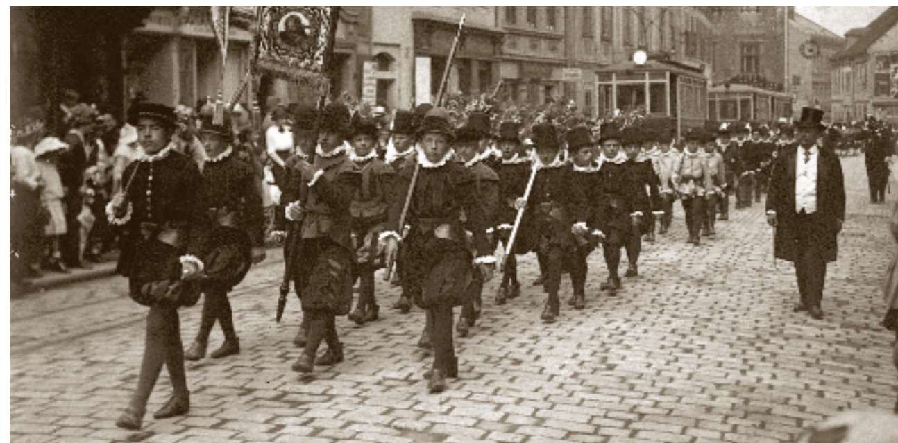
Haviříský průvod, kolem r. 1920

Z toho všeho je pro nás v současnosti nejhodnotnější a nejcennější zachované dědictví Hauptovy původní profesní činnosti, a to fotografování. Od 90. let 19. století systematicky dokumentoval město, jeho proměny, obyvatele, zvyky a události.