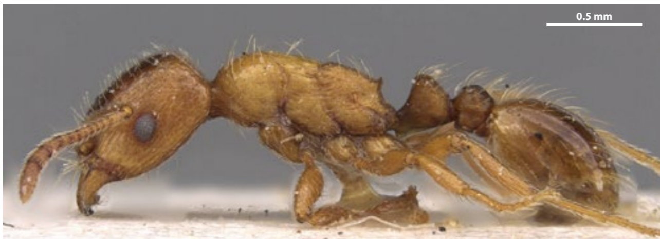
Dělnice mravence Strongylognathus kratochvili.