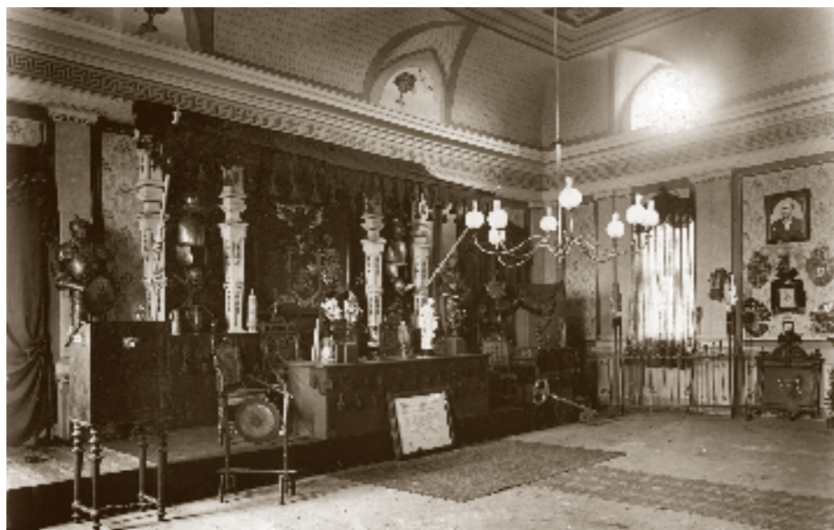
Jihlavský hrad Schlaraffů sídlil v domě Žižkova.