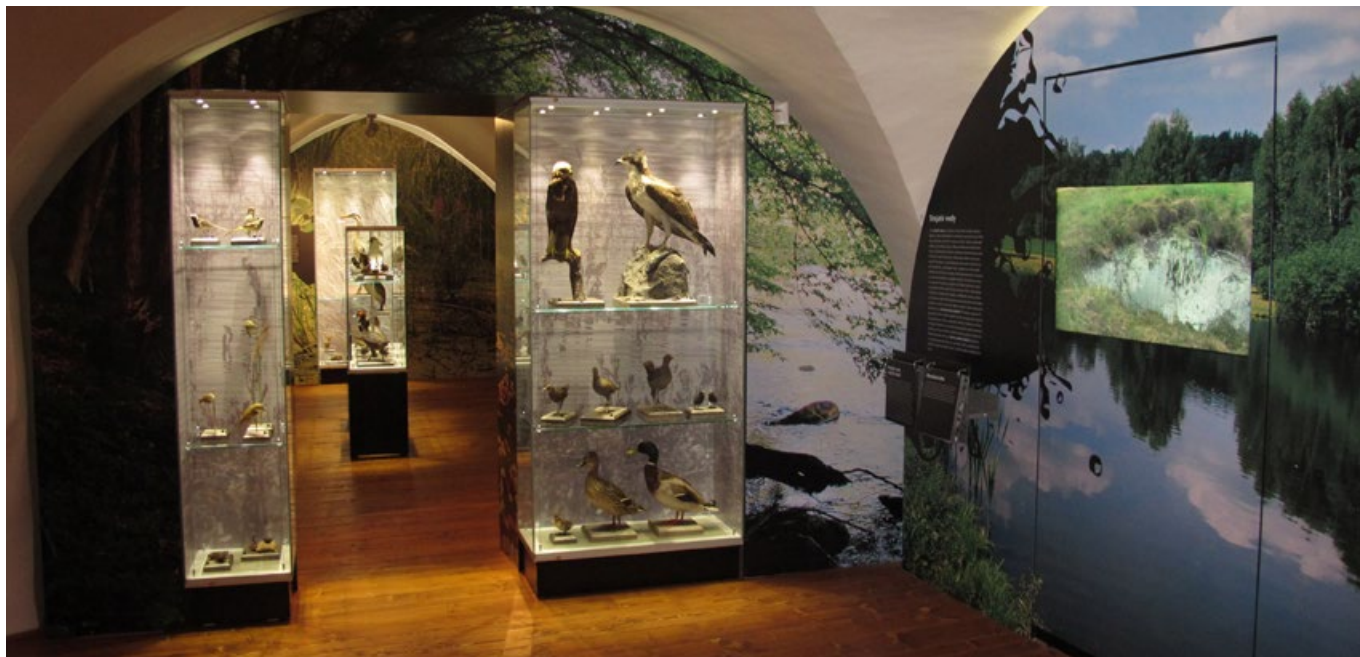
Expozice Vody a mokřady.

Tato expozice seznamuje návštěvníky s nejrozšířenějšími typy nelesních stanovišť na Českomoravské vrchovině, kam řadíme zejména louky a další trávníky, dále pole, zahrady a další místa nalézající se v těsné blízkosti lidských příbytků. Informace o jednotlivých biotopech i jejich obyvatelích, opět rozdělené do několika úrovní, získají návštěvníci prostřednictvím textů, fotografií i preparátů živočichů, a to jak obratlovců, tak i hmyzu. Součástí expozic jsou různé samoobslužné aktivity (včetně práce s mikroskopem), určené hlubším zájemcům o danou problematiku a také video projekce.