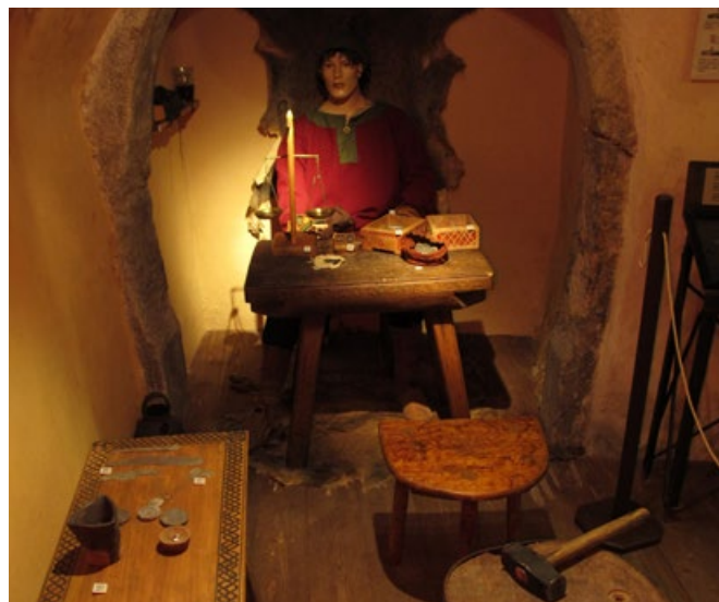
Výroba mincí.