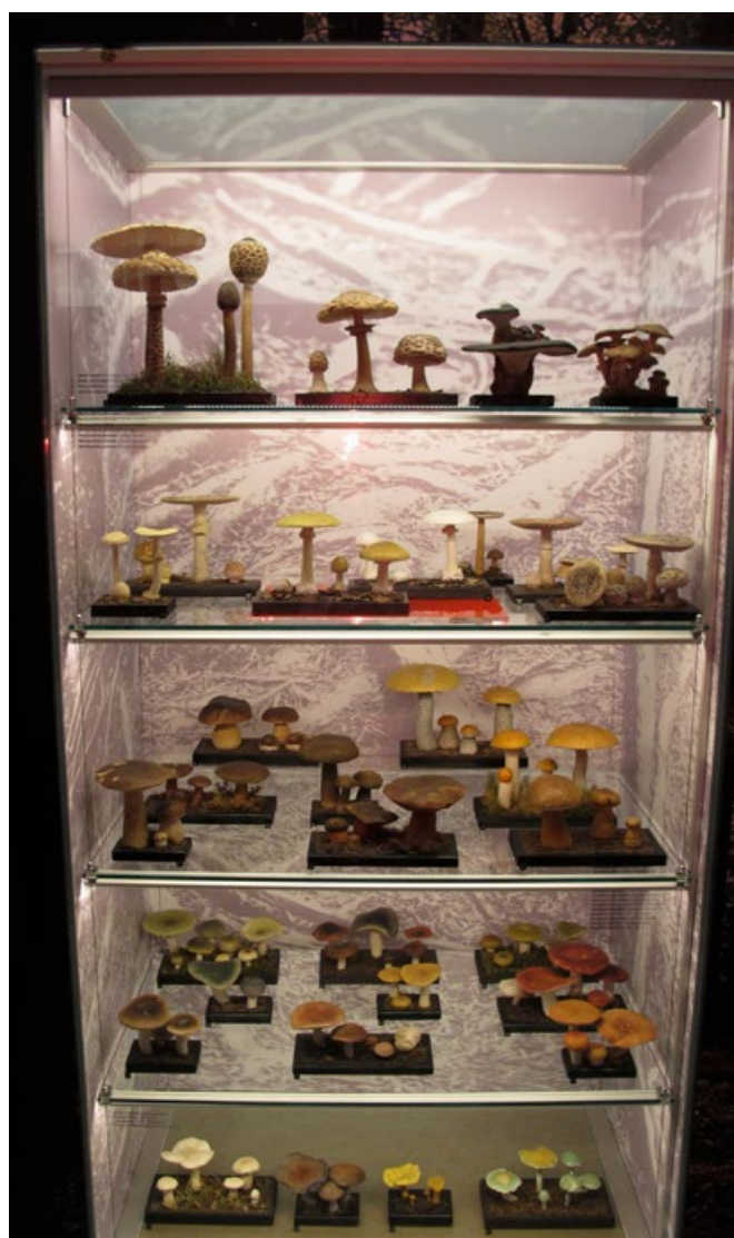
Modely v expozici.

Zdroj: Růžička I. 1971: Modely hub Josefa Poura ve sbírkách Muzea Vysočiny V Jihlavě. – Vlastivědný sborník Vysočiny, oddíl věd přírodních, 7: 174–180.