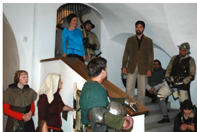
Z vernisáže výstavy 25. září 2014.