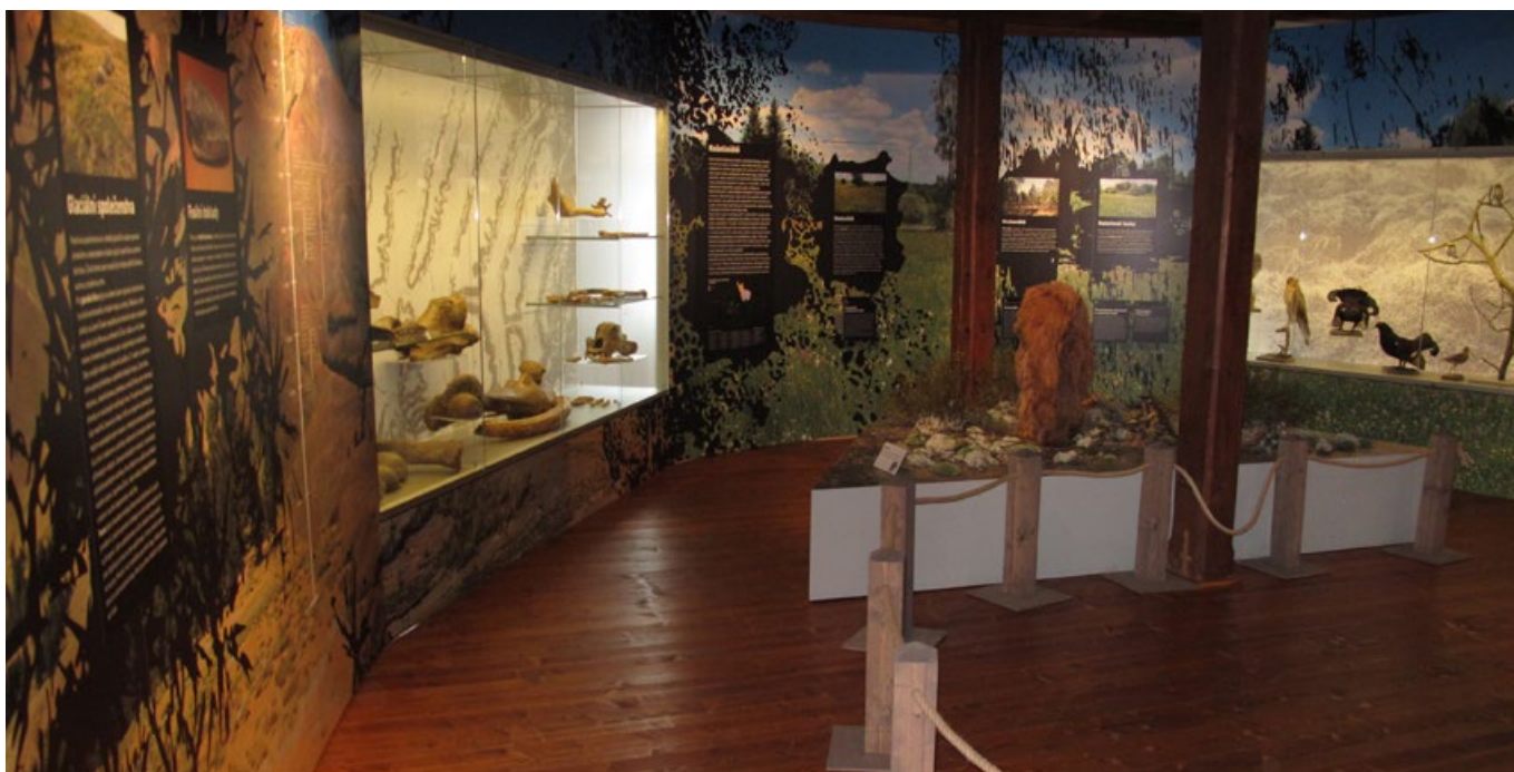
Expozice Od dob ledových...