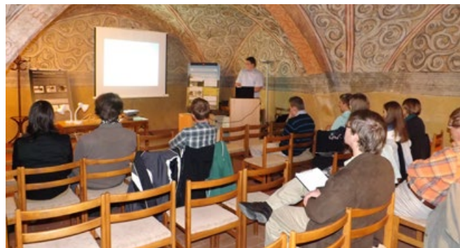
Vystoupení studentů v rámci konference.