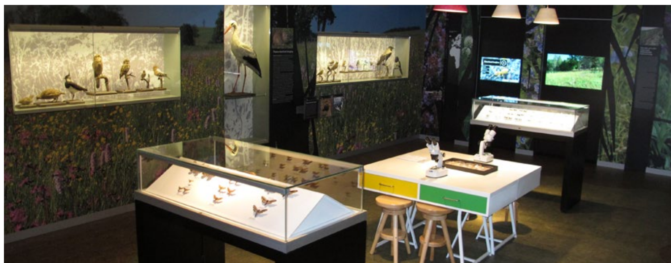
Expozice Otevřená krajina.

Zcela nové přírodovědné expozice jsou zpřístupněny ve čtyřech sálech muzea, které jsou věnovány čtyřem základním typům přírodního prostředí Českomoravské vrchoviny, a to lesům, otevřeně krajině, vodám a rašeliníštím.