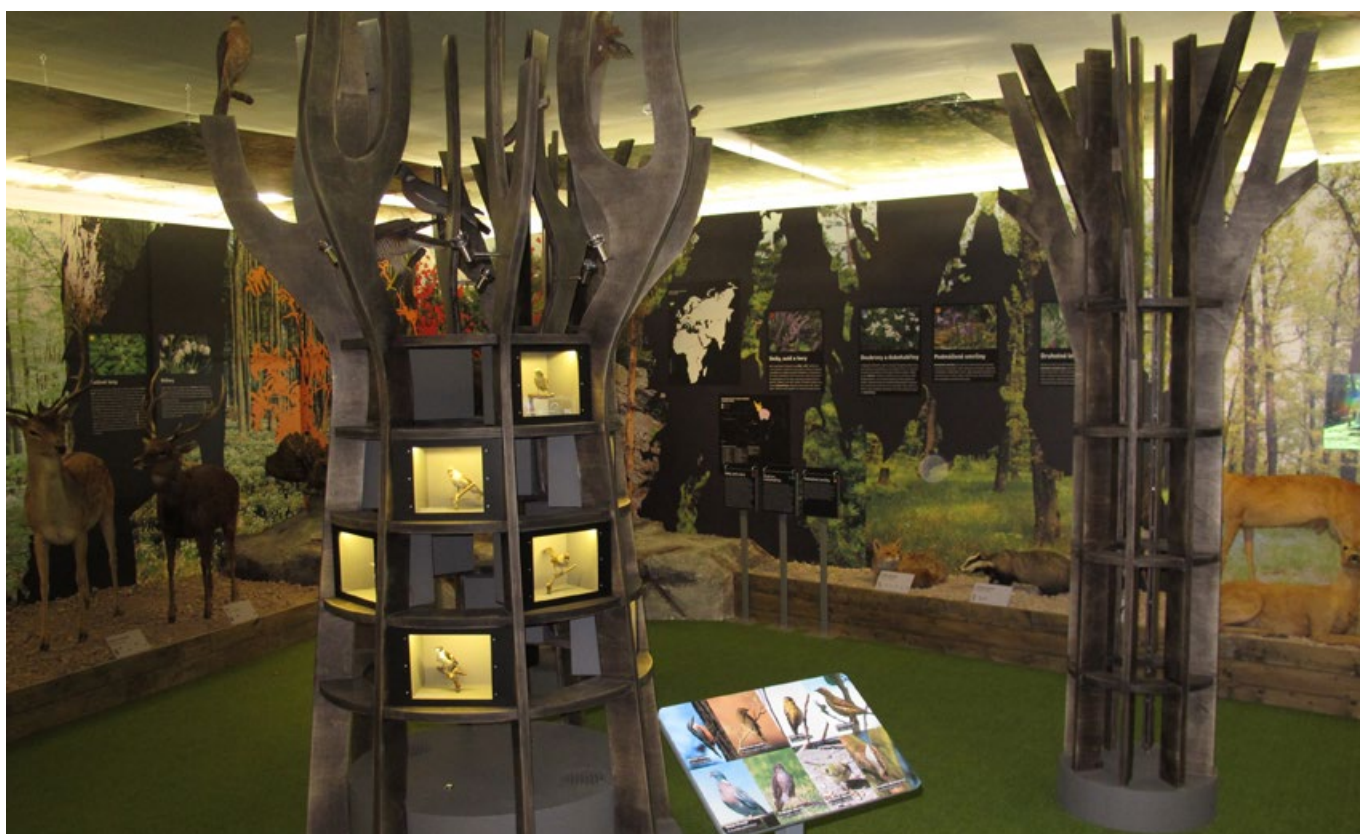
Expozice Lesy.