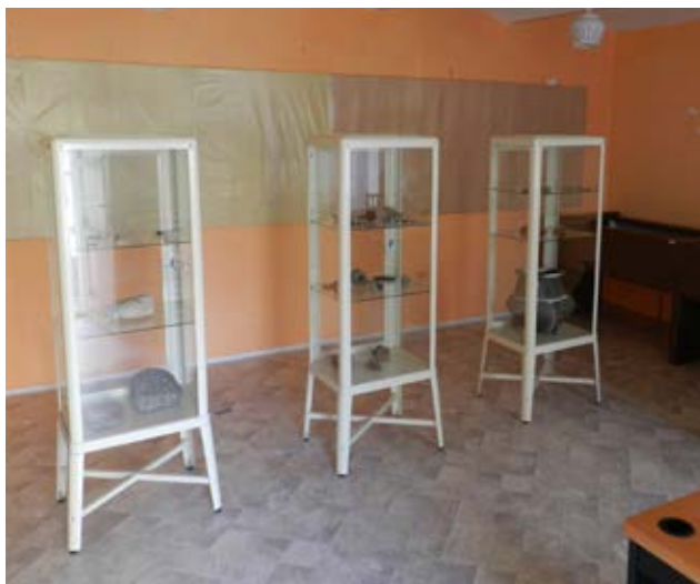
Příprava expozice na faře v Mohelně