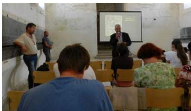
Bývalá konírna valtického zámku – místo prezentace příspěvků