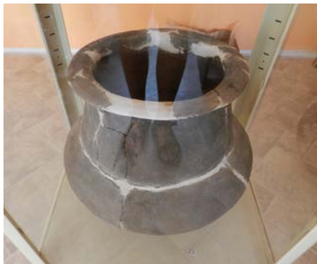
Amfora – pohřební urna z doby bronzové