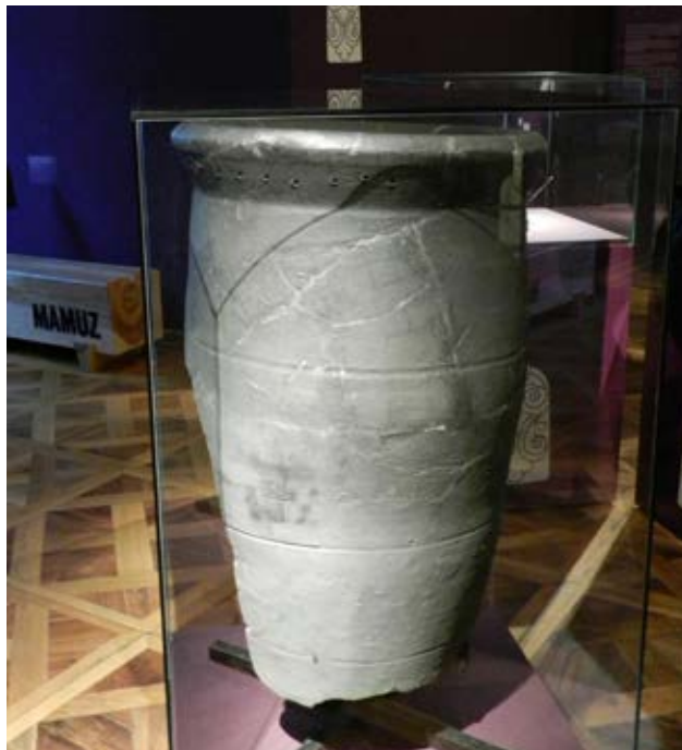
Archeologická expozice v Asparn an der Zaya, středověká keramická zásobnice