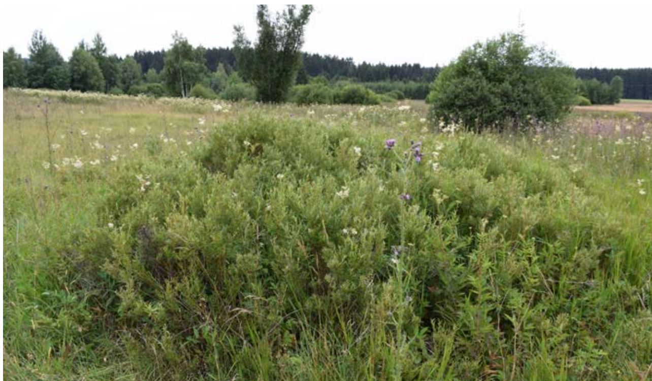
Niva Svatky jižně Herálce s vrbou rozmarýnolistou v popředí