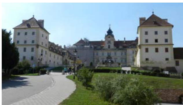
Zámek ve Valticích – místo konání konference