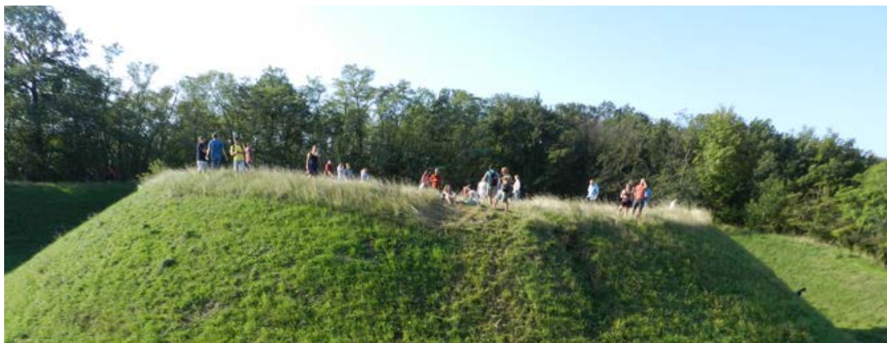
Geiselberg v Dolním Rakousku