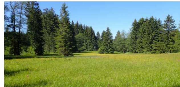
Zkoumaná rezervace.

Přírodovědné oddělení Muzea Vysočiny Jihlava již přes 30 let úzce spolupracuje se Správou Chráněné krajinné oblasti Žďárské vrchy na přírodovědném průzkumu CHKO, která patří v České republice k těm plošně největším. Bezsporně nejdůležitější formou této spolupráce je tvorba inventarizačních průzkumů cenných lokalit. Jedná se o soupisy organismů (ať již rostlinných či živočišných) na lokalitách (nejčastěji na chráněných územích, jakými jsou přírodní rezervace či přírodní památky), které slouží jako podklady pro tvorbu plánů péče o tato území, vyhodnocení kvality a formy probíhající péče či jako vstupní data pro vyhlásování nových chráněných území. V roce 2015 jsme takto zpracovali botanický inventarizační průzkum Přírodní rezervace Olšina u Skleného, která leží v centrální části CHKO Žďárské vrchy. Lokalitu sledujeme dlouhodobě, často zde pracoval RNDr. Ivan Růžička, dlouholetý muzejní botanik a ani pro toho současného se nejednalo o první návštěvu této cenné plochy. Navíc jsme navázali na kolegy z Moravského zemského muzea v Brně, kteří zde inventarizační průzkum, ovšem s důrazem na mechorosty, zpracovali v r. 2007. Během výzkumu jsme zde zaznamenali 147 taxonů vyšších rostlin, z nichž 16 figuruje v Červeném seznamu rostlin České republiky. Znalce přírody jistě potěší výskyt chráněných