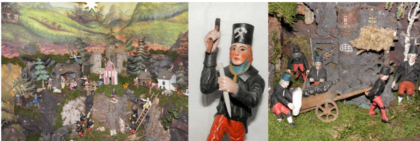
Detaily z vystavených betlémů.