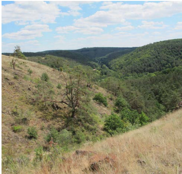
Mohelenská step na konci léta.