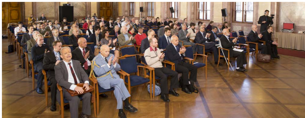
Účastníci konference.