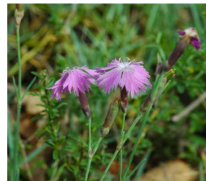
Endemitický hvozdík moravský Dianthus moravicus