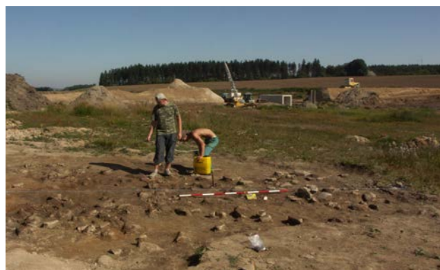
Obr 1: Výzkum kamenné usedlosti na zaniklé vsi Zhořec u Stonařova, léto 2009.

Během archeologických výzkumů v letech 2009 až 2015 bylo na těchto lokalitách získáno množství artefaktů vypovídajících o životě vrcholně středověkých vesnic v centrální části Českomoravské vrchoviny. Vystaveny jsou především kovové předměty získané pomocí detektorové prospekce. Jedná se