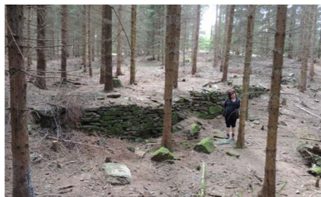
Obr 2: Dokumentace zaniklé vsi Střenčí u Jestřebí, léto 2014.