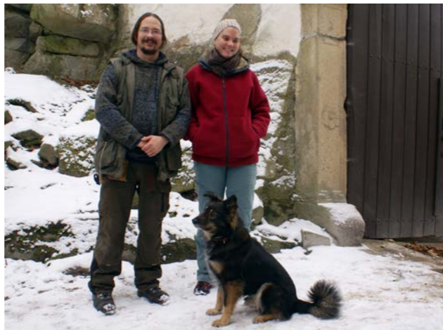
Manželé Rozinkovi – noví správci hradu Roštejn.

Muzeum Vysočiny Jihlava vypsal konkurz na místo kastelána/kastelánky a na místo správce – údržbáře. I když jsme kořetovali s myšlenkou rozjet seznamku a zaměstnat svobodnou kastelánku a svobodného správce, nakonec jsme z přibližně tří set padesáti žádostí vybrali mladé manžele. Během léta na hra-