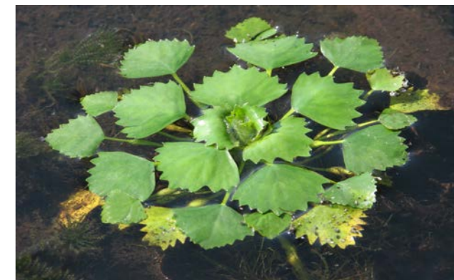
Kotvice plovoucí ( Trapa natans ).

V terénní části semináře jsme navštívili botanické lokality v Chráněné krajinné oblasti Poodří. Tato oblast je v rámci celé České republiky unikátní vodními a mokřadními biotopy, v nichž roste celá řada vzácných a ohrožených vodních rostlin, neboli makrofyt. Jednou z nich je kotvice plovoucí ( Trapa natans ), kriticky ohrožená rostlina, jejíž škrobnaté oříšky se v historických dobách používaly jako potravina. V současnosti se v České republice trvale vyskytuje pouze v Poodří, kde je však její výskyt tak masový, že během léta porůstá celé hladiny rybníků a způsobuje problémy při jejich obhospodařování. Další exkurze nás zavedly do lesů kolem řeky Olše, do pískovny na Opavsku, ale i na postindustriální biotopy odkališť, výsypek či oblastí s důlními pokesy. Vynechat jsme nemohli ani výstup na nejvyšší bod Ostravy, uvnitř stále hořící a kouřící haldu Emu dosahující výšky 324 m n. m. Samozřejmě nemohla chybět