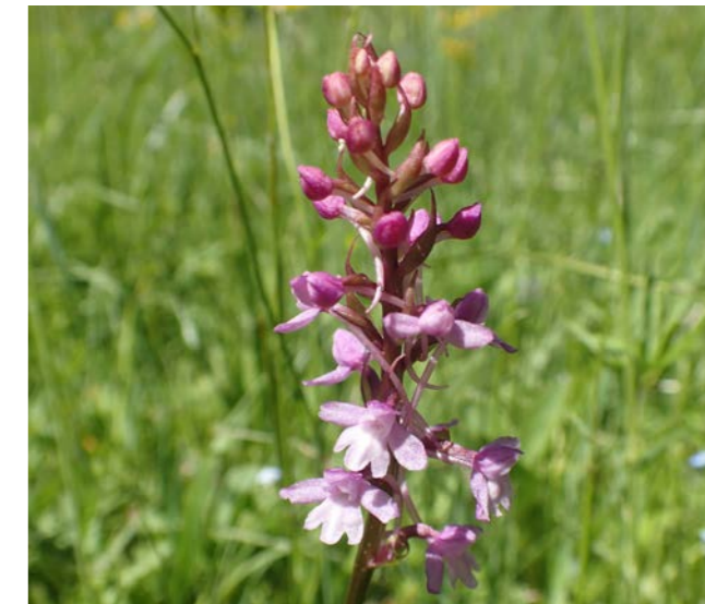
Orchidej pětiprstka žežulník ( Gymnadenia conopsea ).

Přírodovědné oddělení Muzea Vysočiny Jihlava již přes 30 let úzce spolupracuje se Správou Chráněné krajinné oblasti Žďárské vrchy na přírodovědném průzkumu CHKO, která patří v České republice k těm plošně největším. Bezsporně nejdůležitější formou této spolupráce je tvorba inventarizačních průzkumů cenných lokalit. Jedná se o soupisy organismů (ať již rostlinných či živočišných) na lokalitách (nejčastěji na chráněných územích, jakými jsou přírodní rezervace či přírodní památky), které slouží jako podklady pro tvorbu plánů péče o tato území, vyhodnocení kvality a formy probíhající péče či jako vstupní data pro vyhlásování nových chráněných území. V roce 2015 jsme takto zpracovali botanický inventarizační průzkum Přírodní rezervace Olšina u Skleného, která leží v centrální části CHKO Žďárské vrchy. Lokalitu sledujeme dlouhodobě, často zde pracoval RNDr. Ivan Růžička, dlouholetý muzejní botanik a ani pro toho současného se nejednalo o první návštěvu této cenné plochy. Navíc jsme navázali na kolegy z Moravského zemského muzea v Brně, kteří zde inventarizační průzkum, ovšem s důrazem na mechorosty, zpracovali v r. 2007. Během výzkumu jsme zde zaznamenali 147 taxonů vyšších rostlin, z nichž 16 figuruje v Červeném seznamu rostlin České republiky. Znalce přírody jistě potěší výskyt chráněných