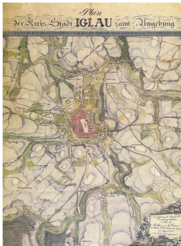
Ukázka digitalizované mapy.