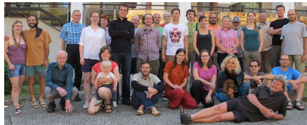
Účastníci hymenopterologické konference