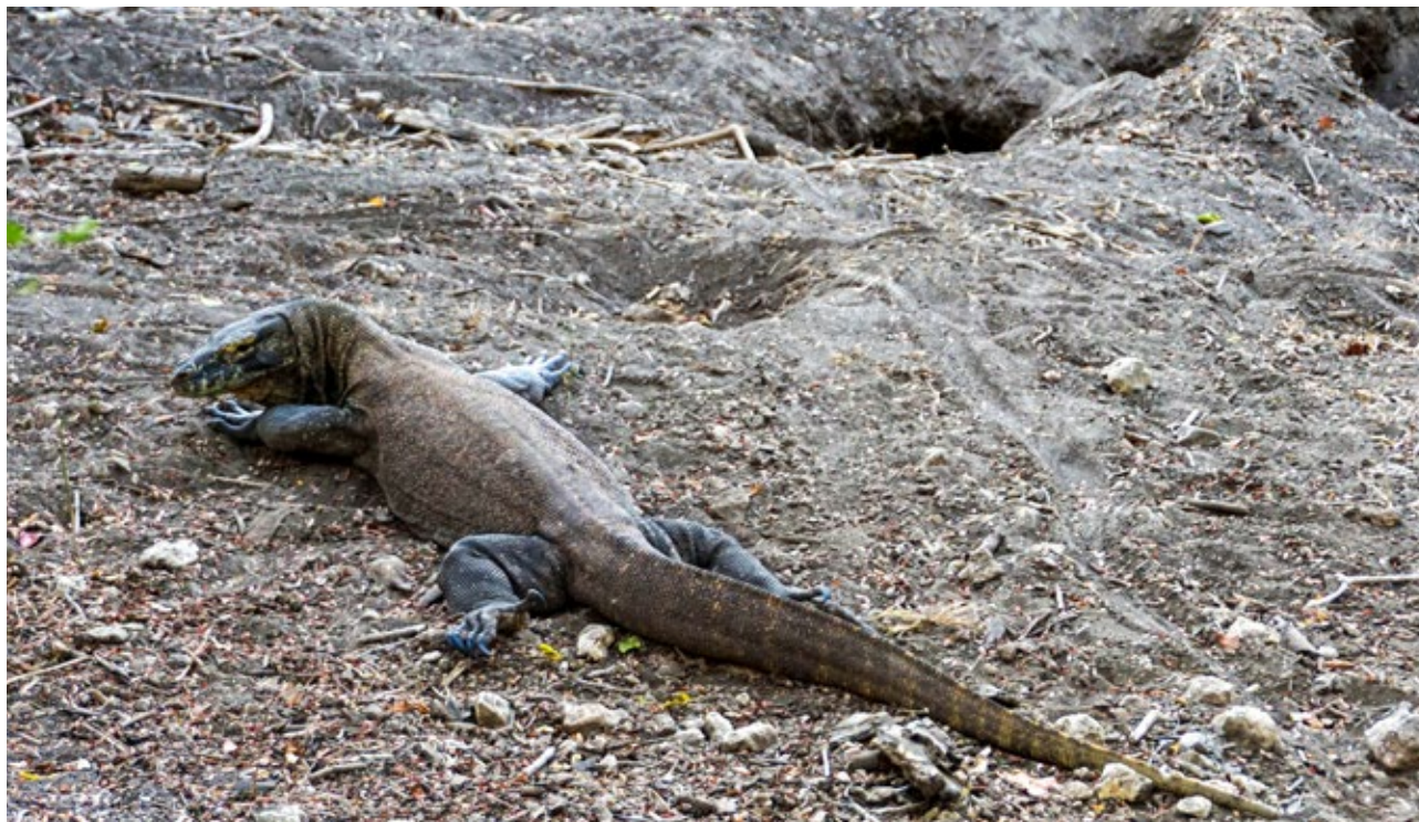
Obr. 6: Ostrov Rinca – samice varana komodského u svého hnízdiště