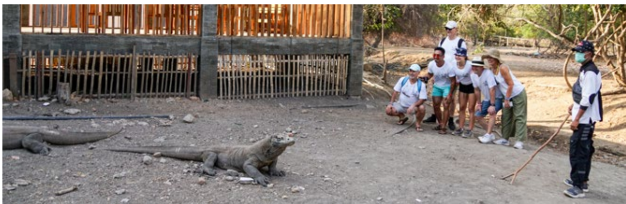
Obr. 4: Ostrov Rinca – průvodce dohlíží na focení turistů s varanem komodským