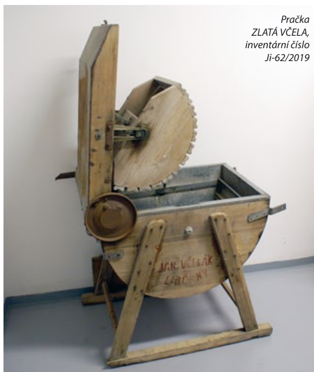
Pračka ZLATÁ VČELA, inventární číslo Ji-62/2019