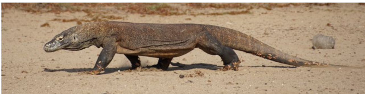
Obr. 5: Ostrov Rinca – varan komodský