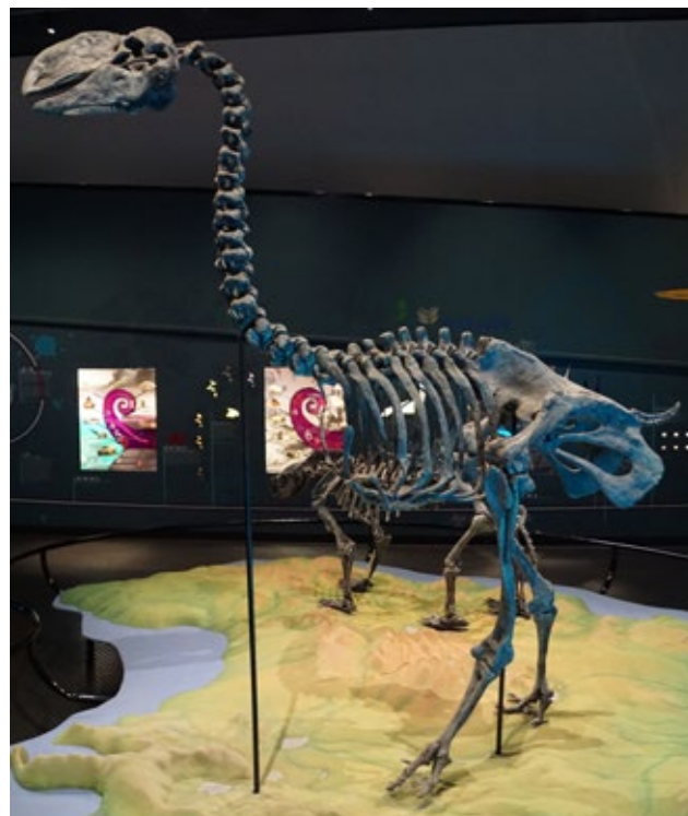
Obr. 3: Dromornis, Muzeum v Darwinu