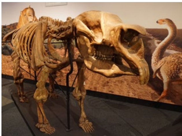
Obr. 2: Diprotodon, Muzeum Jižní Austrálie v Adelaide