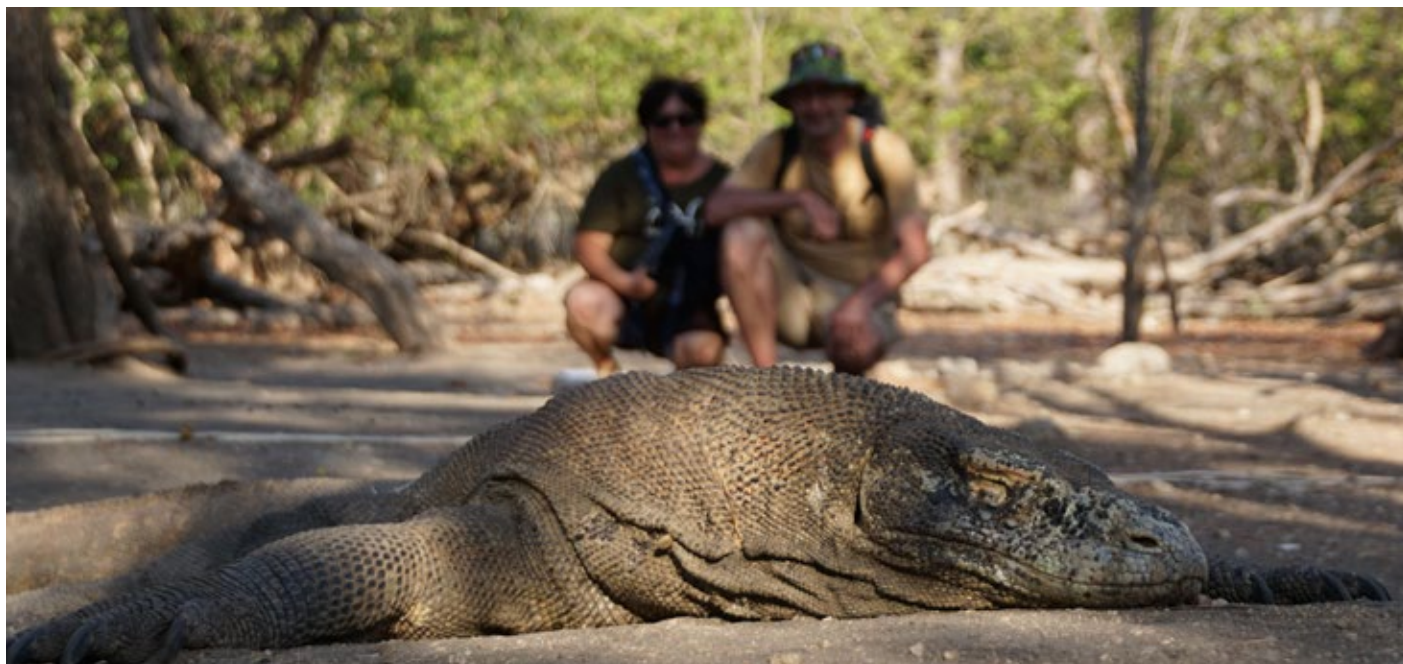
Obr. 1: Varan komodský ležící spící

Z letiště u městečka Labuan Bajo na ostrově Flores jsme se s místním průvodcem a s několika převážně čínskými turisty přesunuli lodí na ostrov Rinca, který je součástí Národního parku Komodo, zapsaného na seznamu Světového dědictví UNESCO. Na ostrově se varani pohybují bez omezení a turisty hlídají zaměstnanci parku s dřevěnými ve spodní části „rozeklanými“ holemi, kterými ještěry udržují v bezpečné vzdálenosti (obr. 4). Hned při vstupu jsme byli poučeni o způsobu lovu varanů, kteří napadají svou kořist v úrovni očí, tedy při zemi, pokoušou ji a pak si jen počkají, až vykrvácí. Raněné jeleny nebo buvolky nepronásledují, protože mršinu ucítí na vzdálenost několika kilometrů, stačí si pro ní po nějakém čase dojít. Poněkud komická situace nastala ve chvíli, kdy průvodce donutil rodiče malého čínského batolete, vzít ho do náručí, aby na něj varani neútočili. Později jsme celou rodinku i s dítětem v podřepu viděli pořizovat si selfie s mohutným varanem jen dva metry vzdáleným. Pokud by se dal do pohybu, asi by neunikli... Napadení člověka jsou poměrně vzácná, poslední registrovaný případ byl zaznamenán v květnu 2017. Po parku