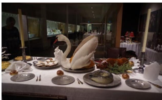
inspirace na prostřený stůl Nordiska Museet, SWE