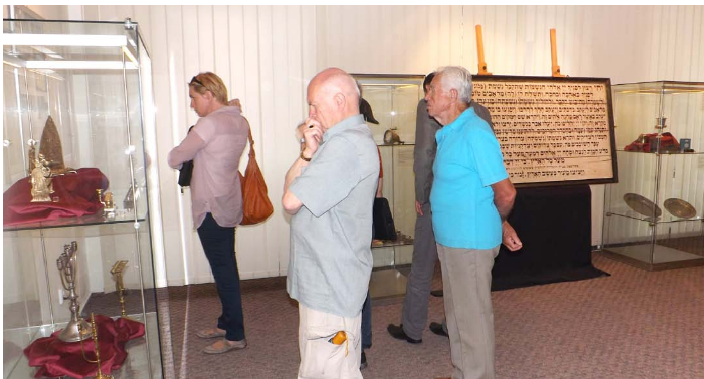
Z vernisáže výstavy.

Ačkoliv výjimečnost židovských památek na Vysočině reprezentuje především židovská čtvrť v Třebíči zapsaná roku 2003 na Seznam světového kulturního a přírodního dědictví UNESCO, lze na území kraje najít i další pozoruhodné památky kdysi početné židovské komunity jako jsou synagogy, židovské čtvrtě či hřbitovy.