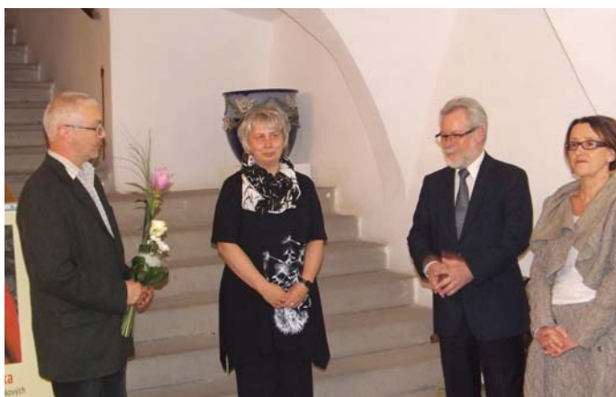
Zahájení výstavy 29. května 2014.