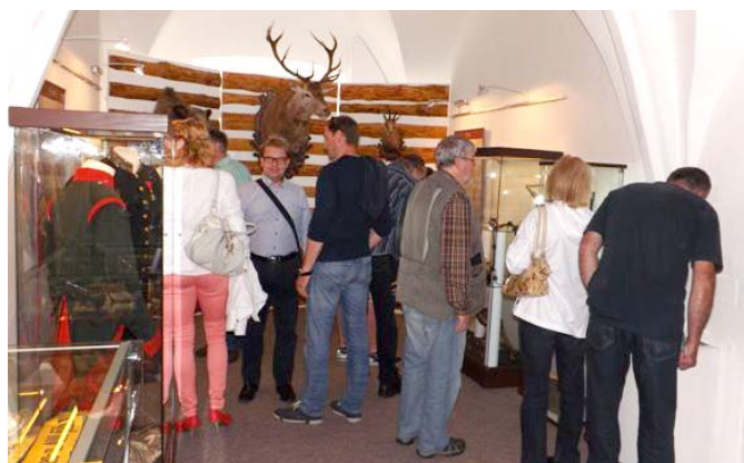
Z vernisáže výstavy.