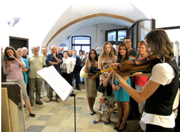
Z vernisáže výstavy.