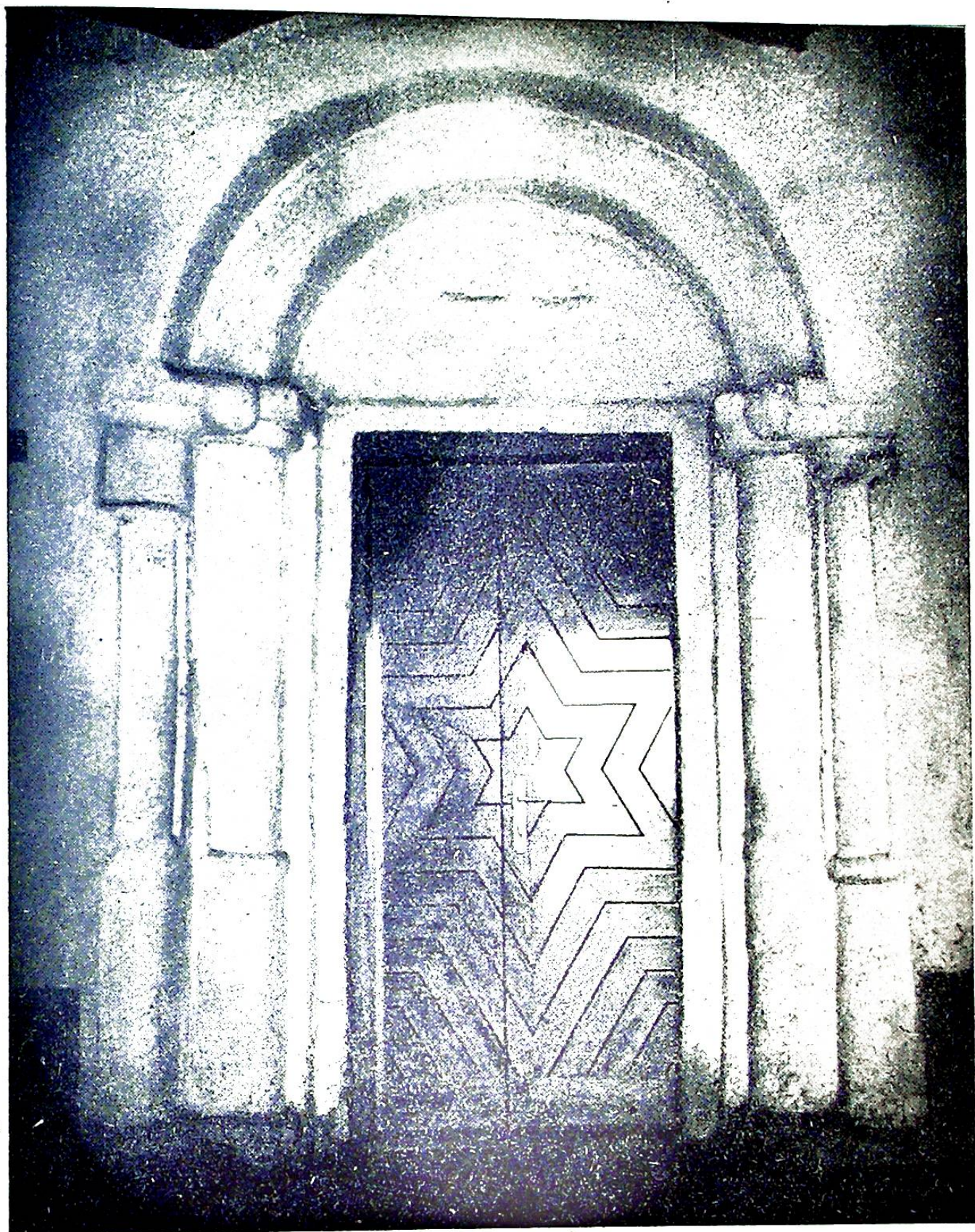
Obr. č. 16. Románský portál kostela v Červené Lhotě.