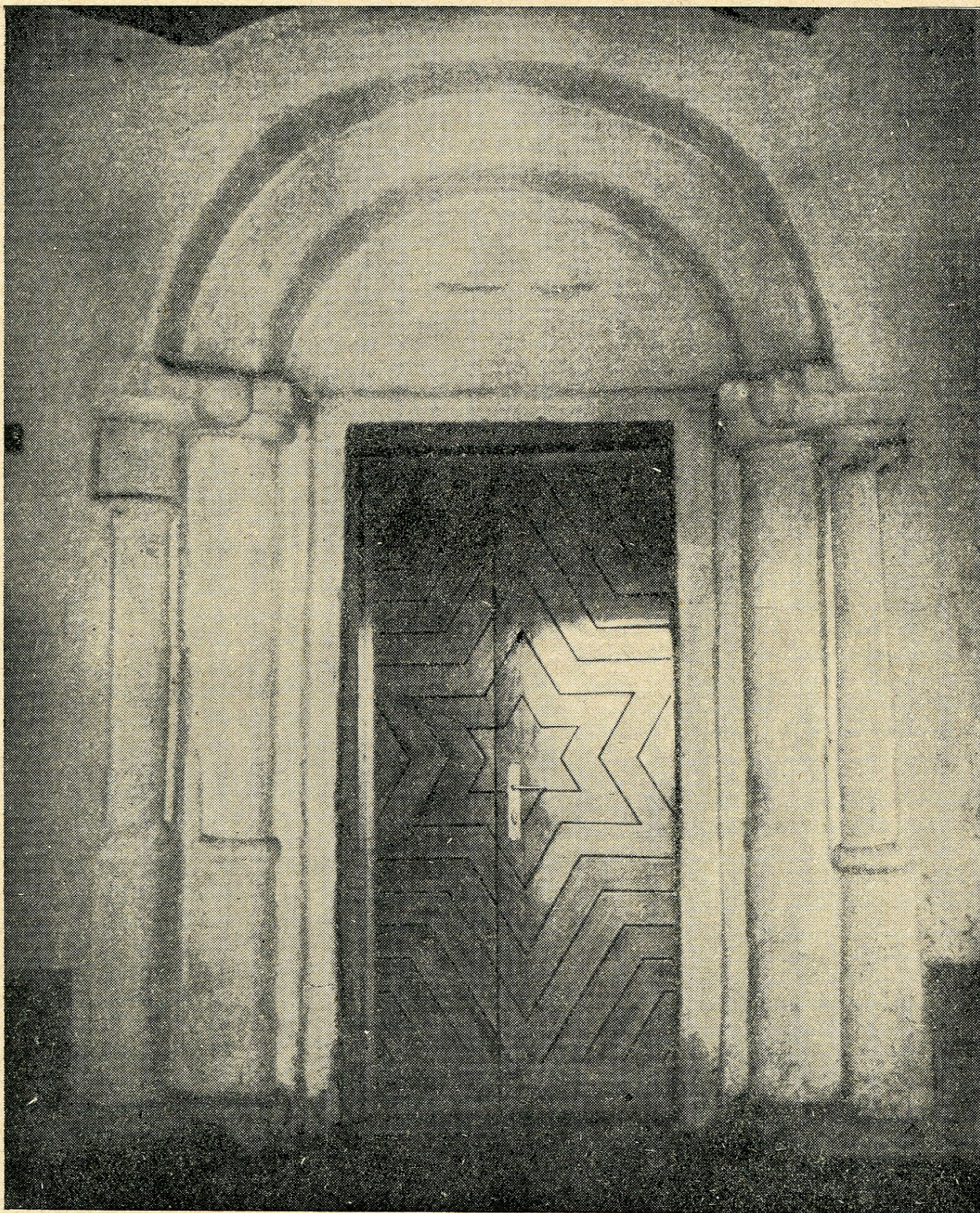
Obr. č. 16. Románský portál kostela v Červené Lhotě.