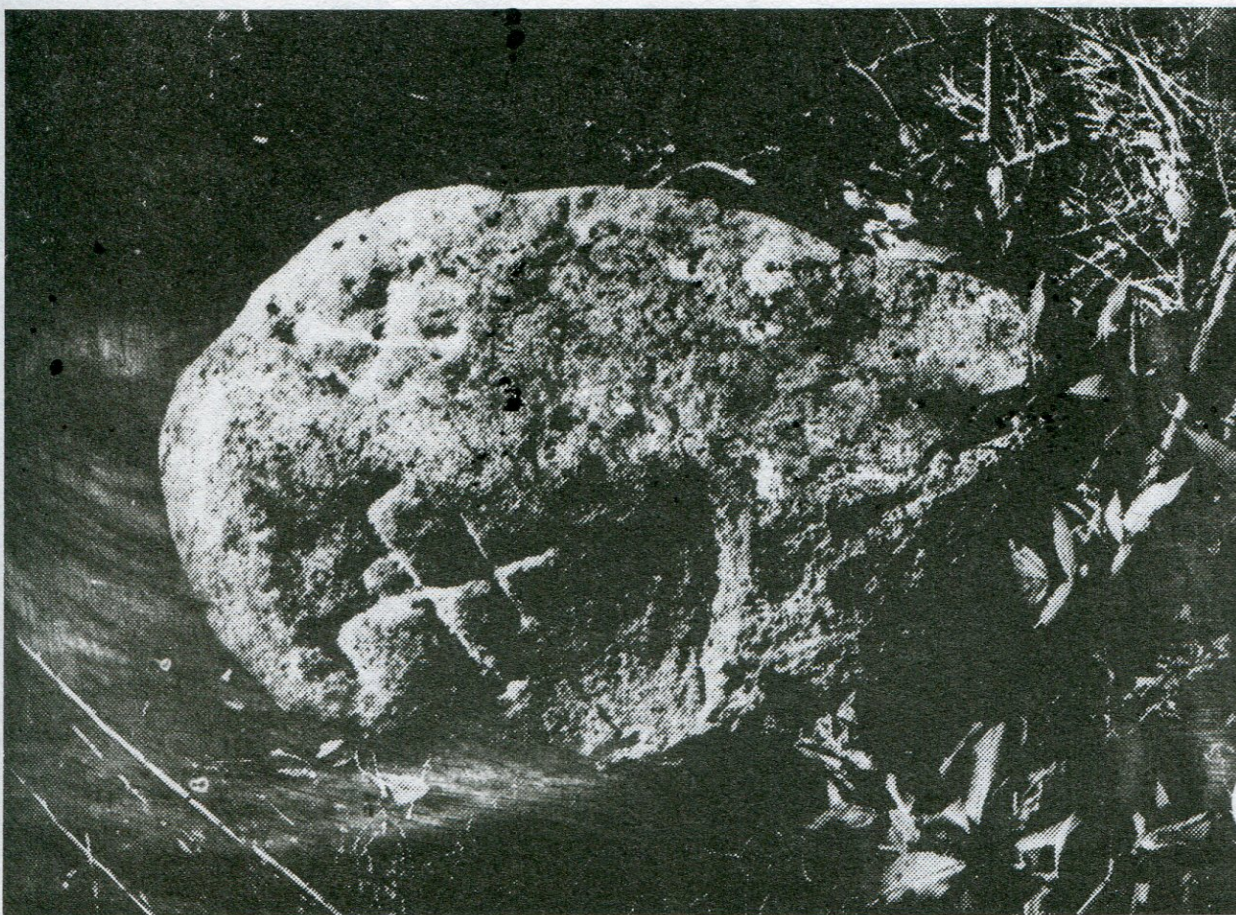
7. Otín, lesní část Farský les, hraniční úsek Pouště. hraničník poř. č. 28. Výška 73 cm, lineární značka, poloha u hranice se Stájíštěmi.