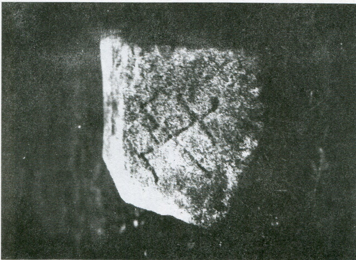
10. Stonařov, část obecní les, hraniční úsek Jestřebský les, hraničník poř. č. 7 zvaný Thingstein, lineární značka.