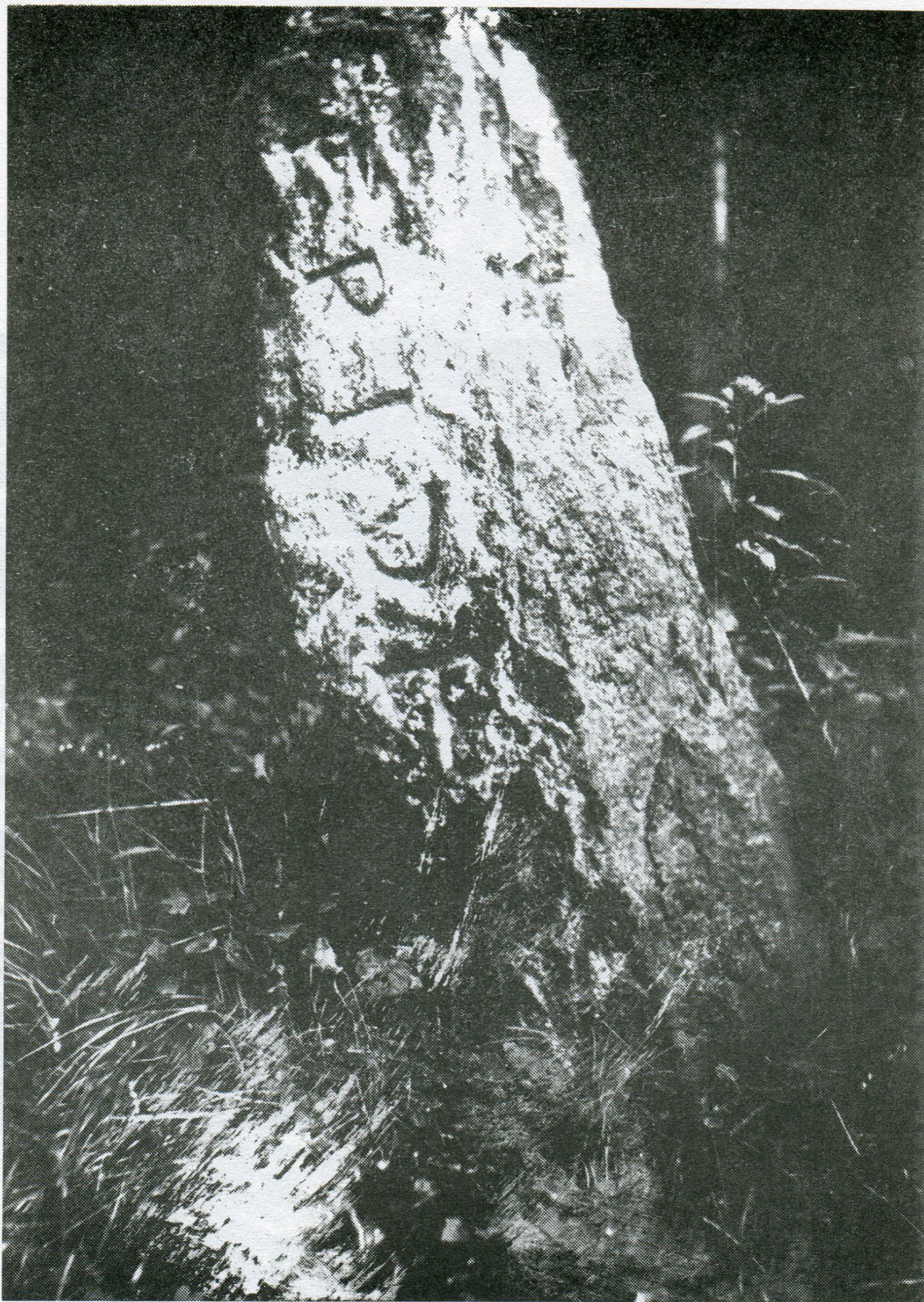
5. Otín, lesní část Farský les, hraniční úsek Pouště, hraničník poř. č. 4. Hraniční smírčí kámen, nápis FRIDE, výška 107 cm. Pohled ze strany jihlavského panství.