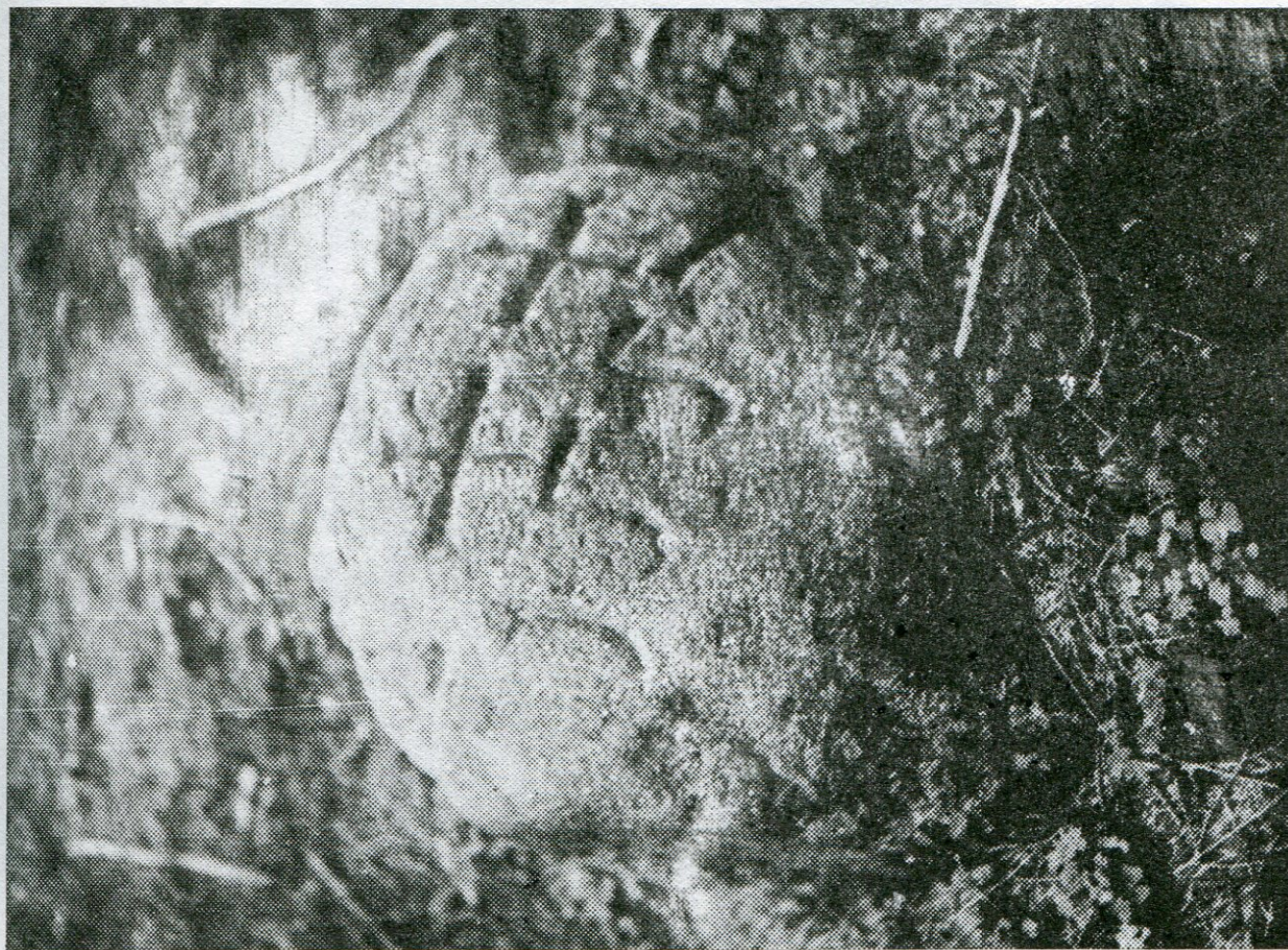
6. Otín, lesní část Farský les, hraniční úsek Pouště, hraničník poř. č. 9.