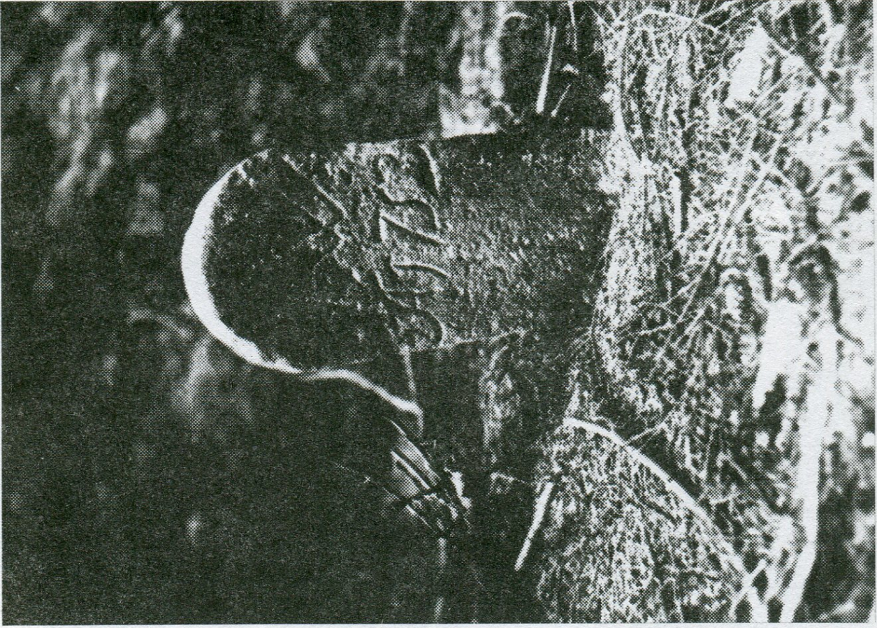
13. Měšín, lesní část Zelený les, hraniční úsek Rytířsko, hraničník poř. č. 6.