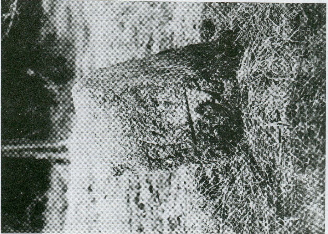
12. Stonařov, hraniční úsek Lhotka, hraničník poř. č. 1.