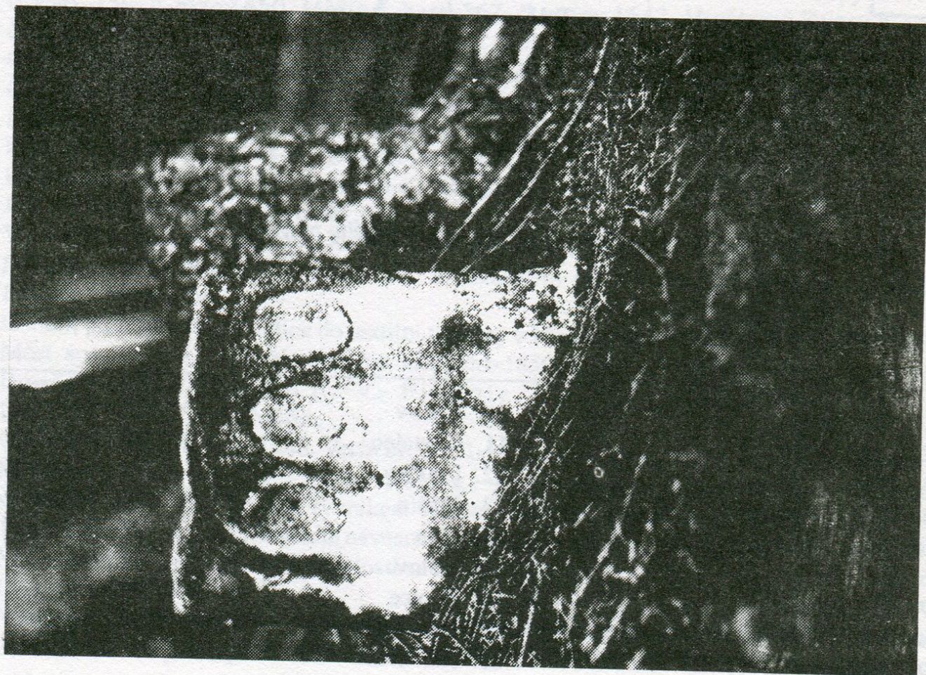
2. Hosov, hraniční úsek s Rantiřovem, hraničník poř. č. 4.