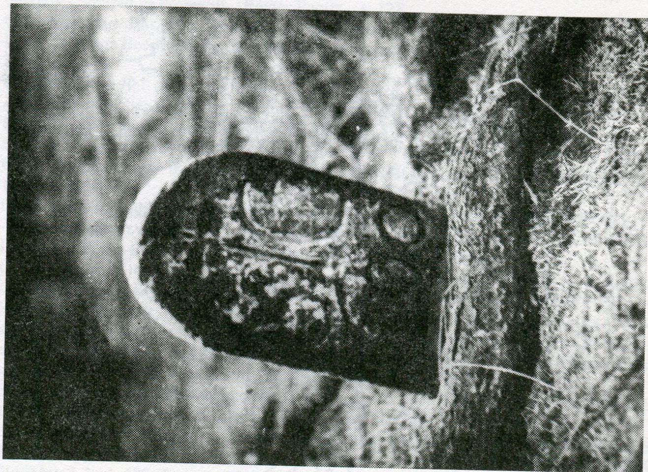
3. Hosov, hraniční úsek s Rantiřovem, hraničník poř. č. 8.