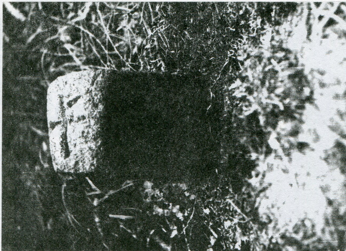
11. Stonařov, část obecní les, hraniční úsek Jestřebský les, hraničník poř. č. 11