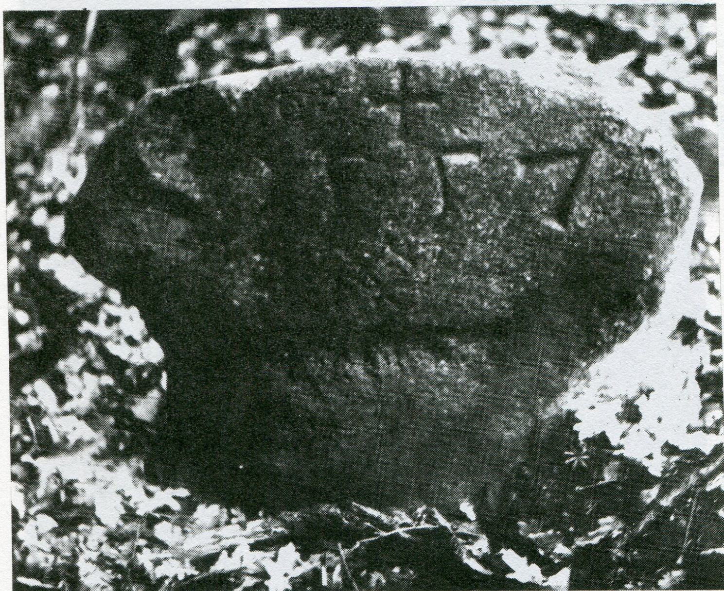
4. Loučky, Beranovec, hraniční úsek bývalého jezdovického revíru a Zadní Pouště hraničník poř. č. 20. Levá strana je orientována ve směru toku hraničního potůčku.