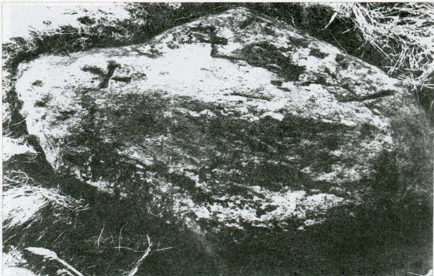
8. Otín, společná hranice pavlovských a dlouhobrtnických pozemků, hraničník poř. č. 1 zvaný Troják.