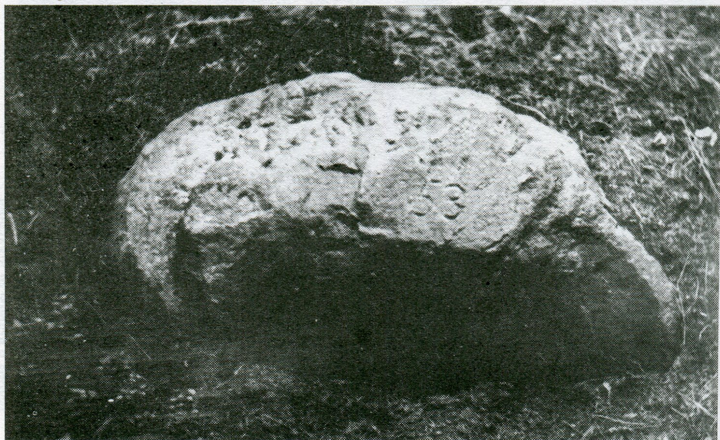
9. Dlouhá Brtnice, lesní část Bukový les, Loučský les, hraniční úsek Hladov, hraničník poř. č. 7. Hranice novoříšského a brtnického panství, poloha V zálomí.