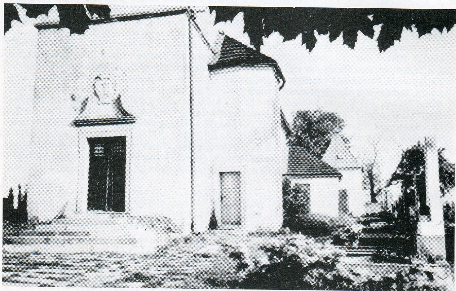
2. Kostel ve Vysokých Studnicích od západu. Zleva věž s hlavním vchodem, vstup na kůr, sakristie a kaple na jihovýchodní straně kostela.