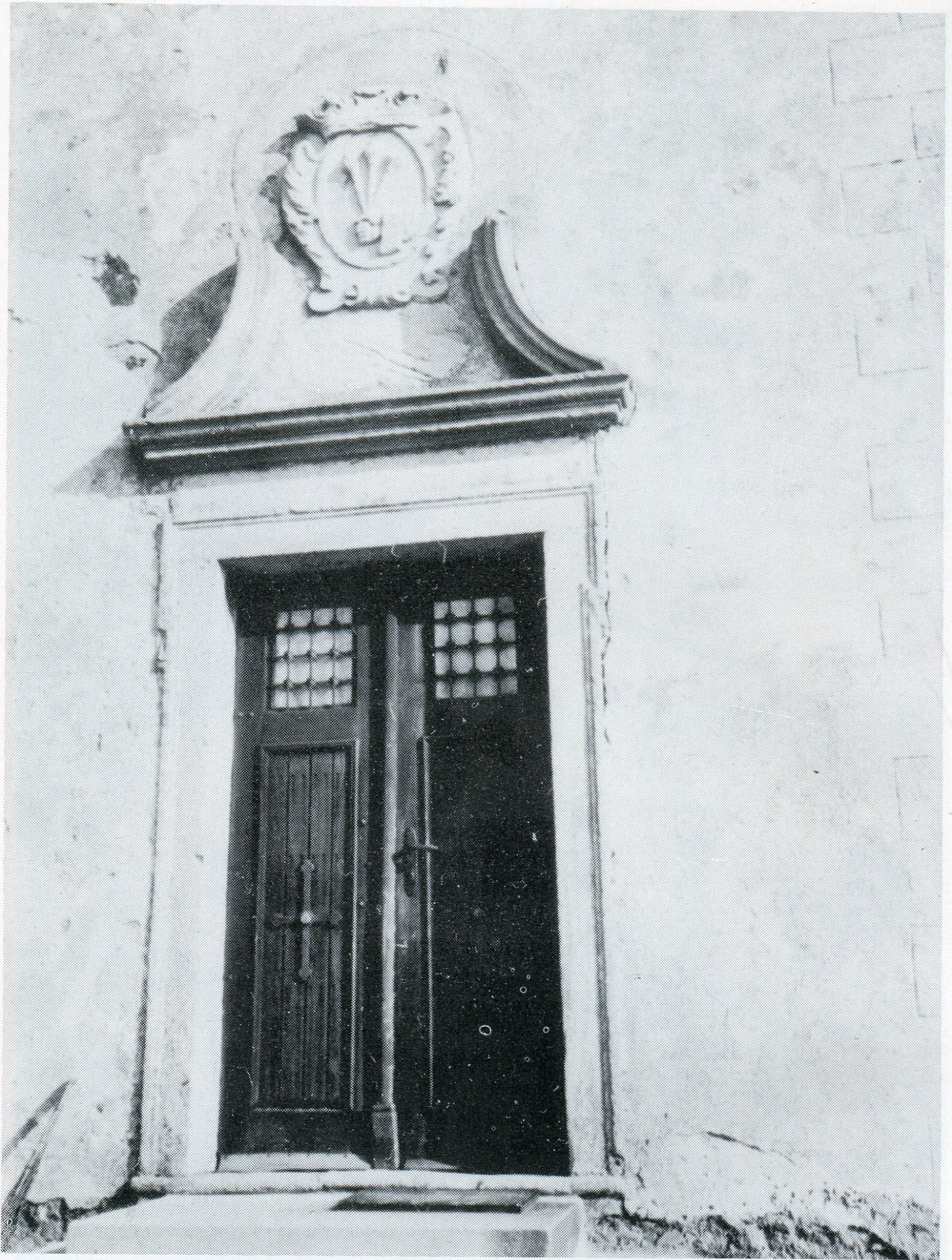
4. Znak Jana Kryštofa Říkovského rytíře z Dobřic nad hlavním vchodem do kostela. Mezi římsou a znakem deska s německým nápisem, vpravo rustikování na nároží.