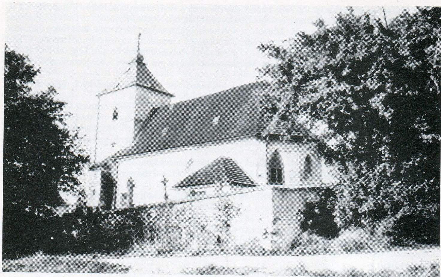
1. Kostel Nejsvětější Trojice ve Vysokých Studnicích od jihovýchodu.