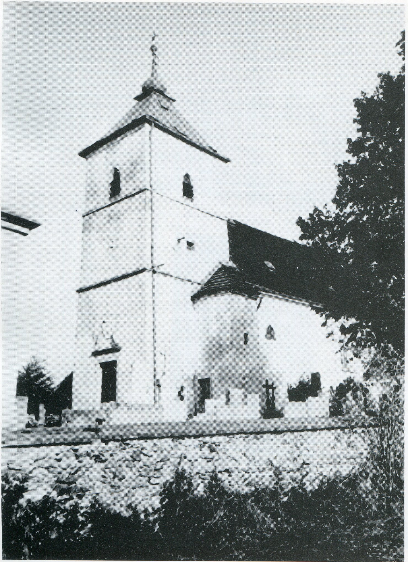
3. Kostel od jihozápadu.