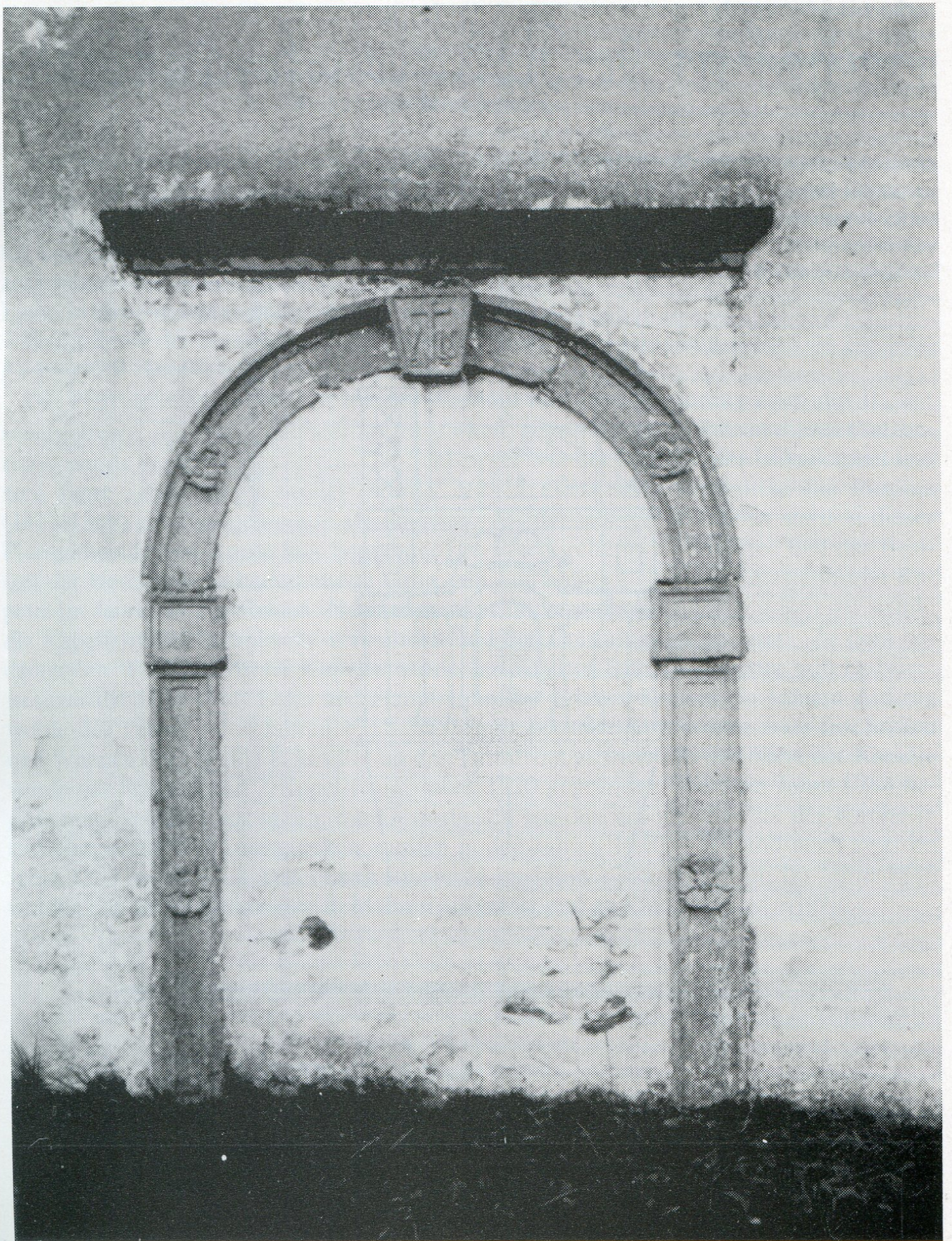
5. Zazděný portál s bývalým bočním vchodem na severní straně kostela.