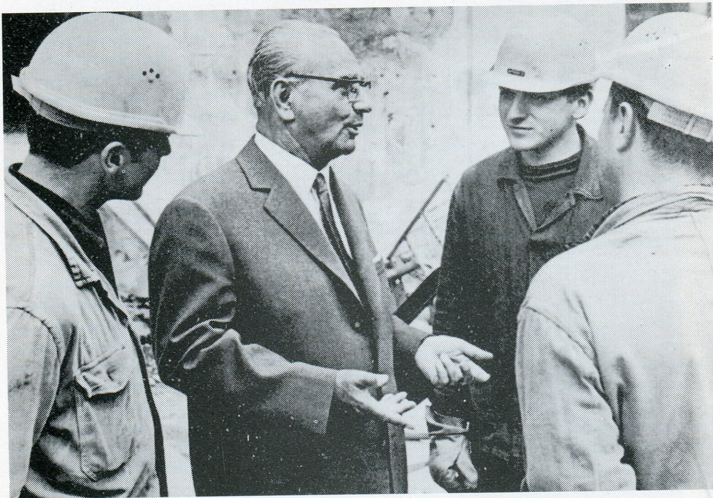
5. Franz Jonas, starosta města Vídně 1951 - 1965, v rozhovoru se stavebními dělníky.