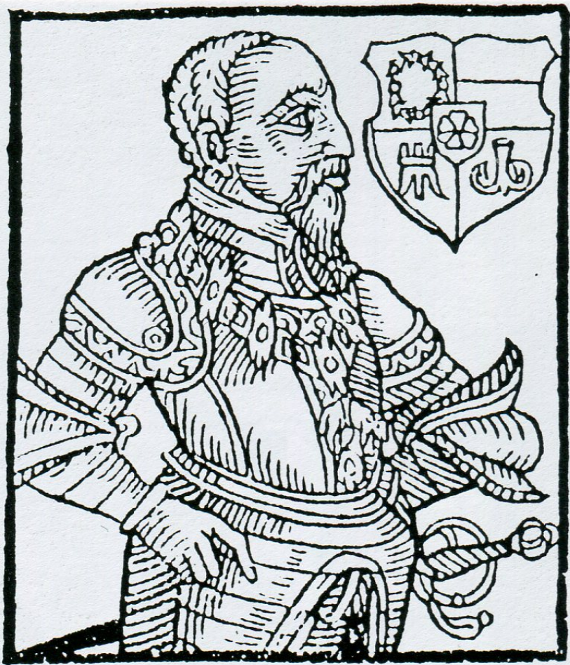
9. Jáchym z Hradce (Paprocký, fol. XXXVIIIa).