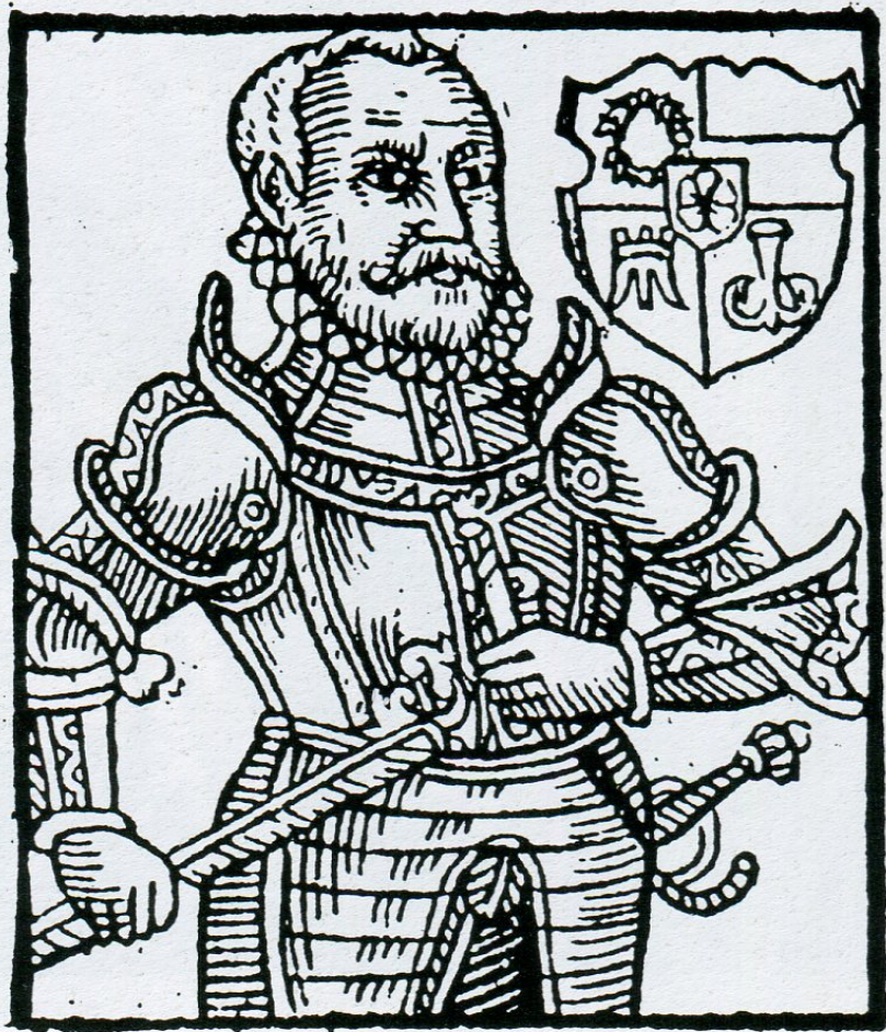
10. Adam II. z Hradce (Paprocký, fol. XXXIXa).