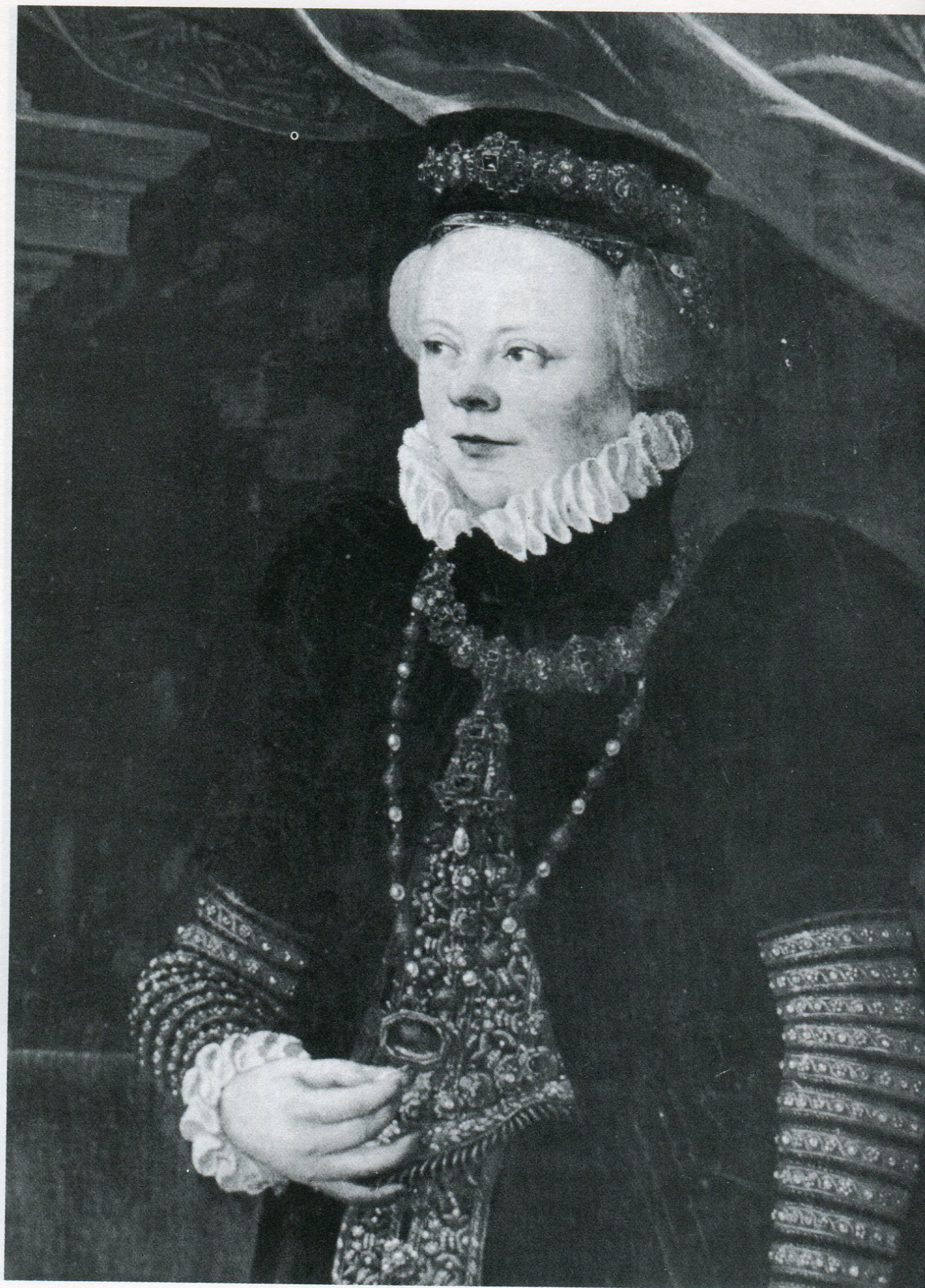
7. Kateřina z Valdštejna (Státní zámek Telč).