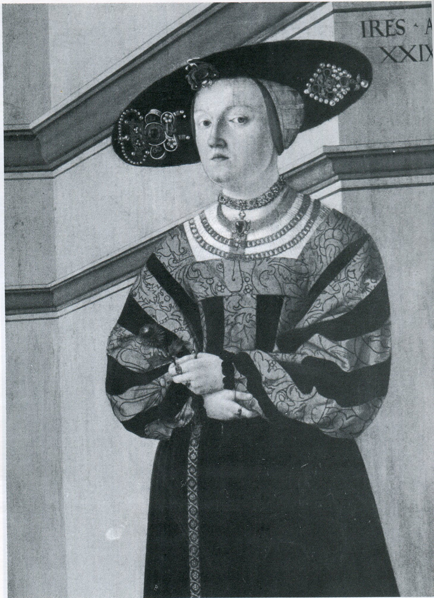
2. Anna z Rožmitálu (portrét od J. Seiseneggera z roku 1529, Státní zámek Telč).