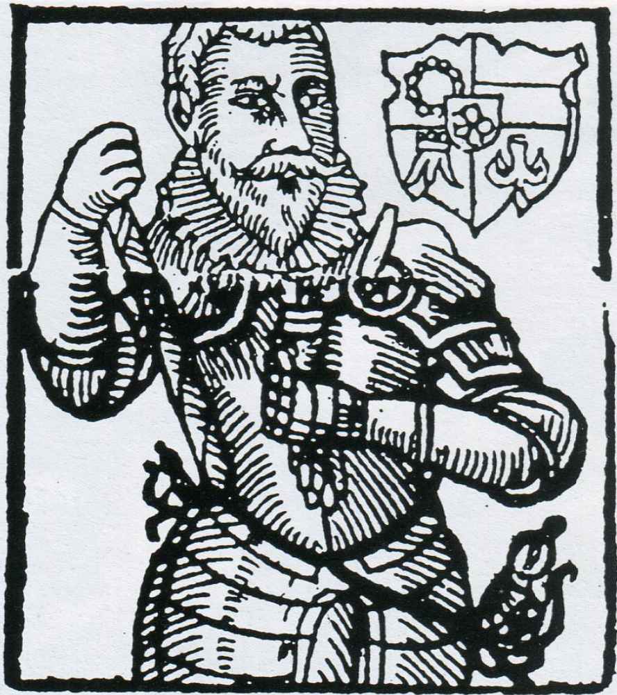
4. Zachariáš z Hradce (Paprocký, fol. XXXVIa).