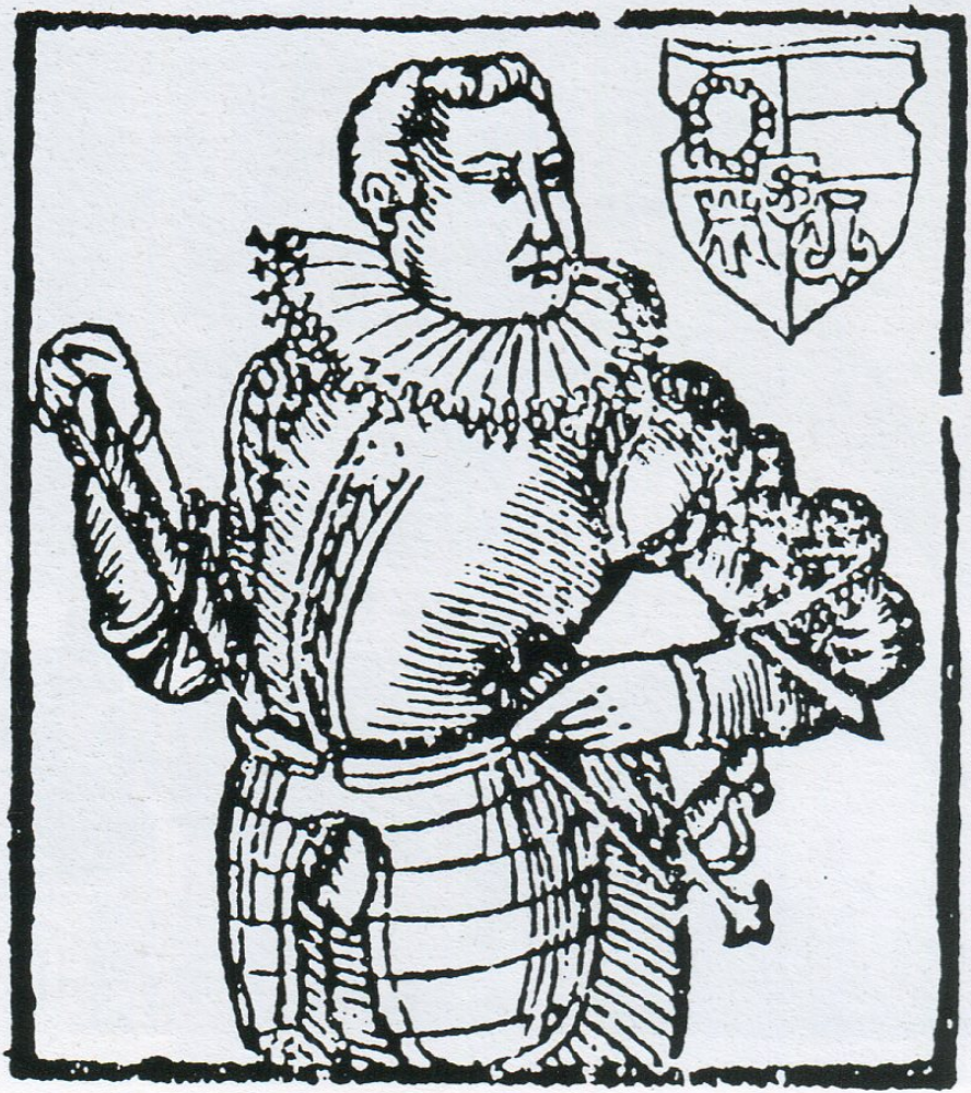
5. Zachariáš z Hradce (Paprocký, fol. XXXVIIIa).