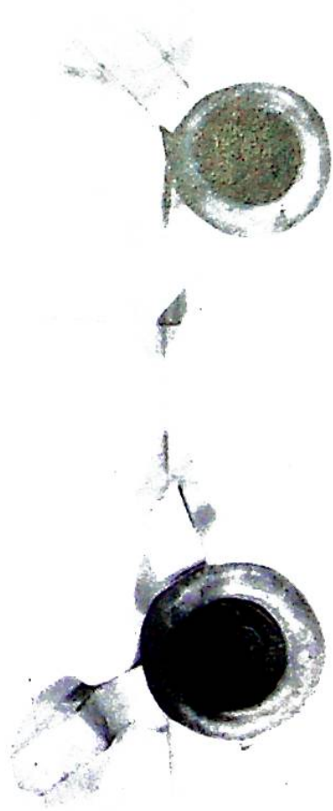
3. Ladislav Pilgramer, rychtář města Jihlavy, a jeho bratr Zikmund prodávají purkmistru, radě a obci města Jihlavy pustou ves Otín u Stona- řova, Rančářův a městkou rychtu se všemi právy za 2200 kop míšeňských grošů. 1505 květen 2. Viz poznámka č. 19. Foto J. Kourková.

Ladislav a Rychtář města Jihlavy, a jeho bratr Zikmund purkmistr, radě a obci města Jihlavy pustou ves Otín u Stona- řova, Rančářův a městkou rychtu se všemi právy za 2200 kop míšeňských grošů. 1505 květen 2. Viz poznámka č. 19. Foto J. Kourková.