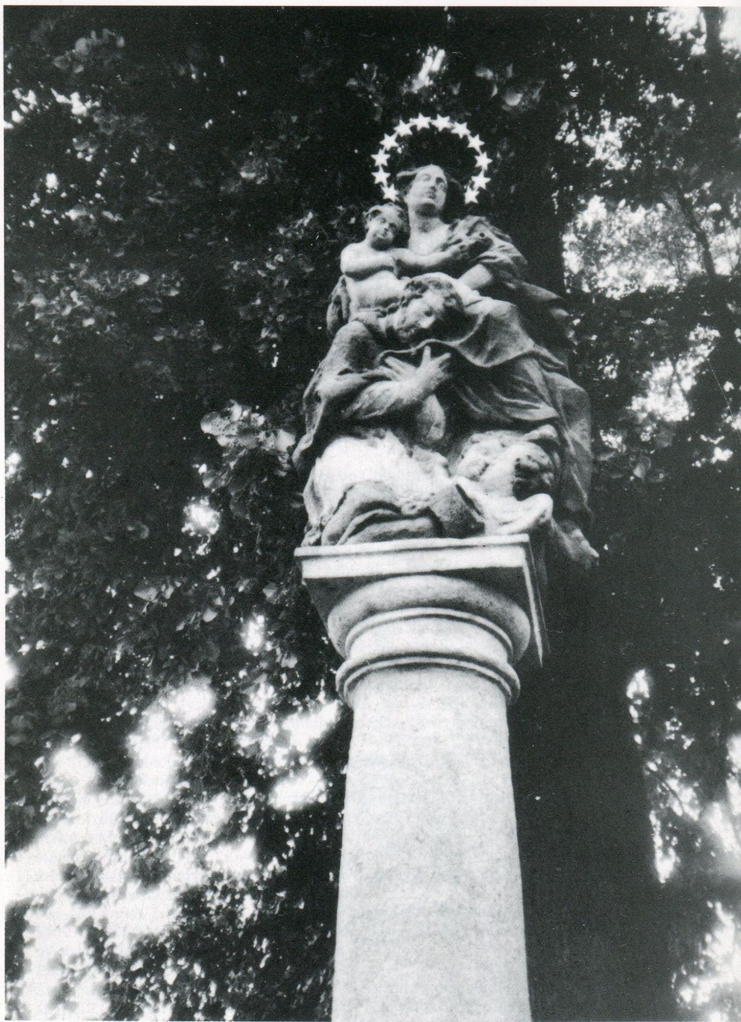
3. Socha Panny Marie s malým Ježíškem a sv. Janem Nepomuckým ze 2. poloviny 18. století n. návsi ve Věžnici.