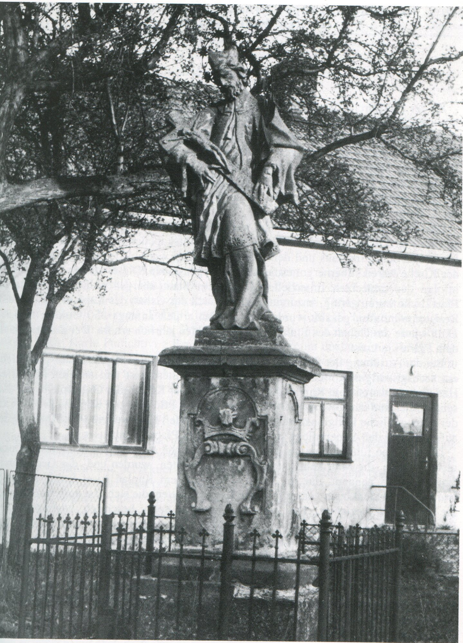
. Socha sv. Jana Nepomuckého z 1. čtvrtiny 19. století na návsi ve Vysokých Studnicích. Foto Josef Vomela.