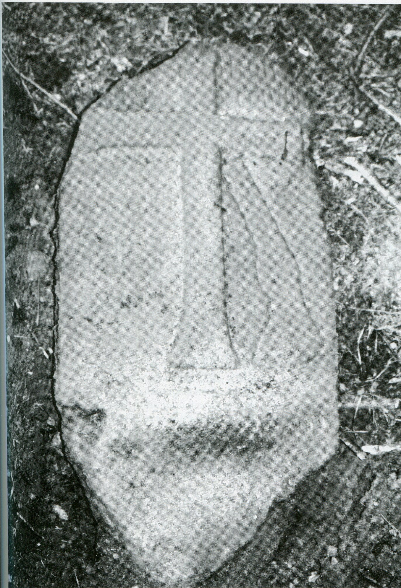
7. Pamětní kámen šarvátky císařských se Švédy v lese Křesovce u Nového dvora z roku 1646.