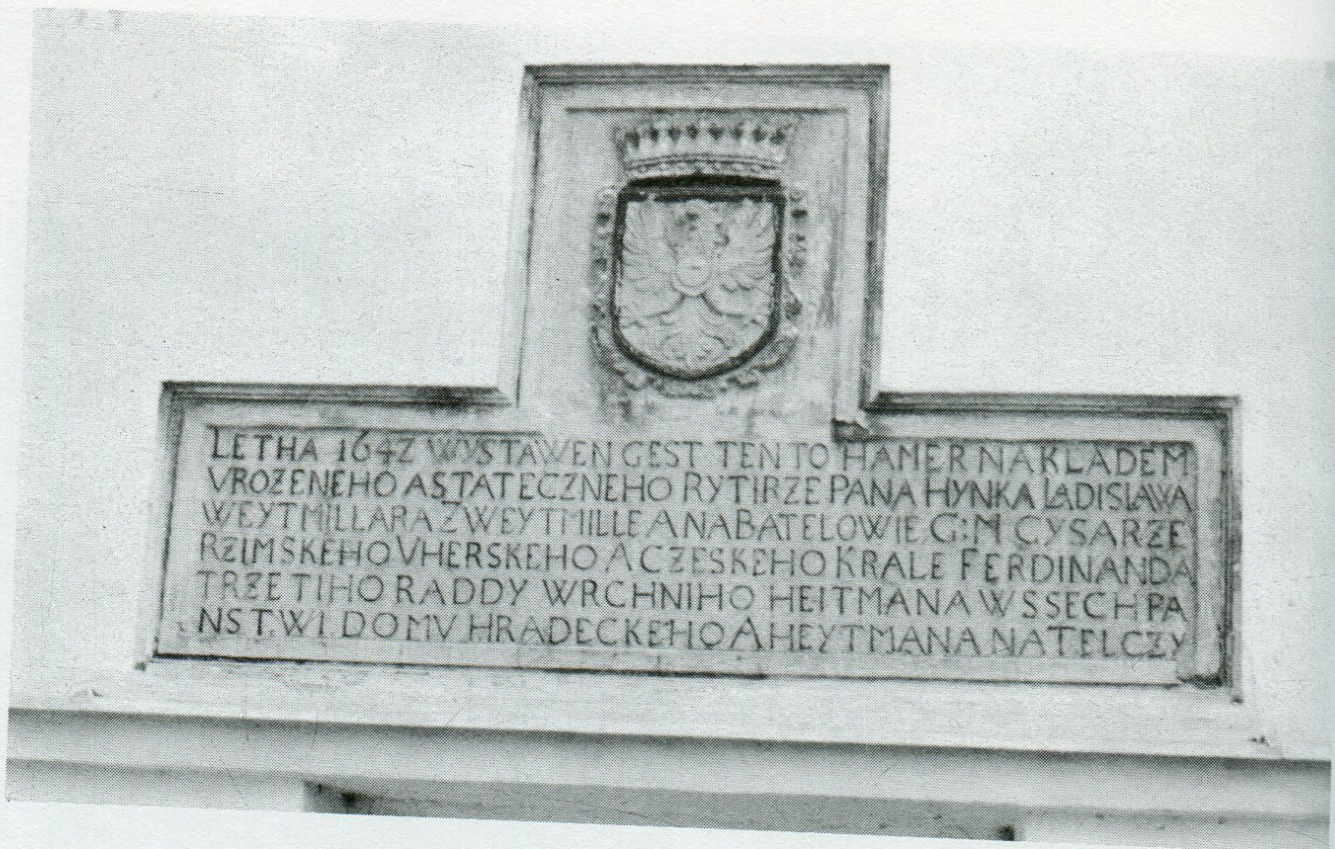
5. Pamětní kamenná deska s erbem Hynka Ladislava Vejtmilara z roku 1642 na budově továrny Motorpalu (bývalého hamru) v Batelově.