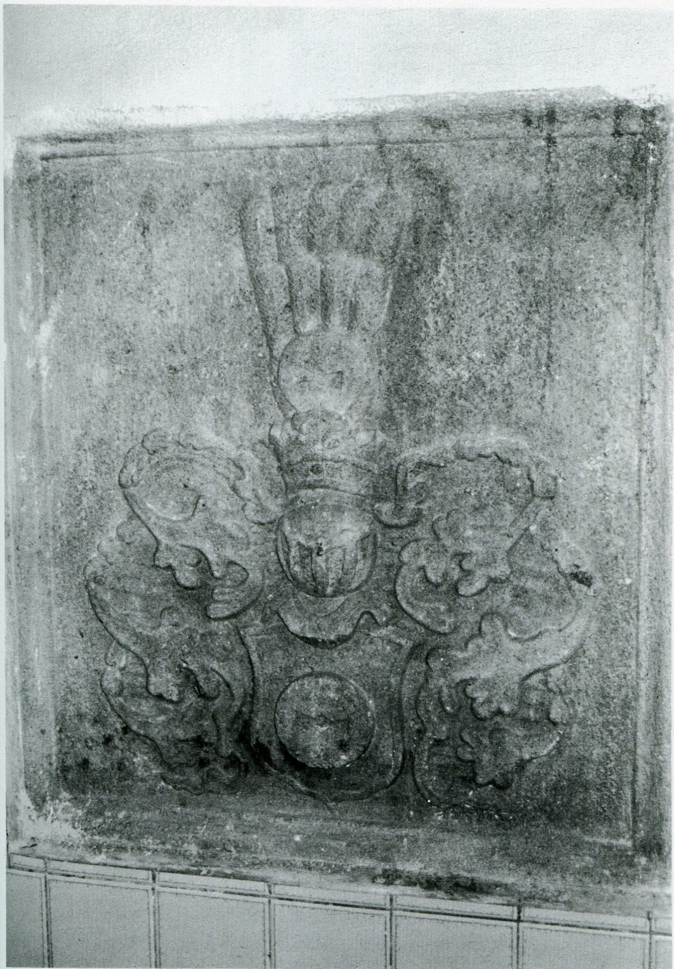
4. Kamenná deska s původním erbem Vejtmilarů v bývalé kapli (nyní kuchyně!) v batelovském zámku.