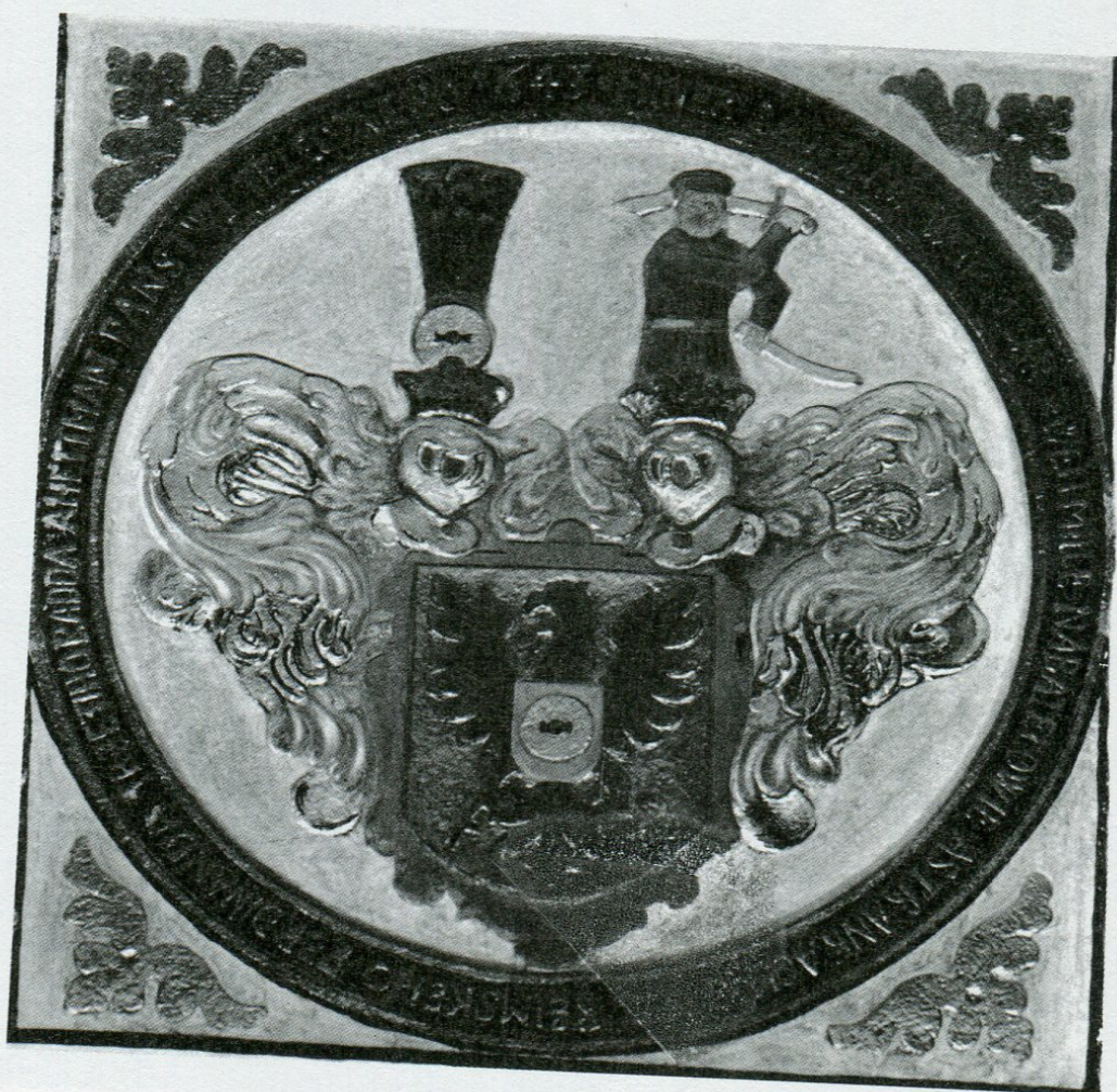
6. Pamětní kamenná deska Hynka Ladislava Vejtmilara z roku 1643 v kostele sv. Jakuba v Telči.