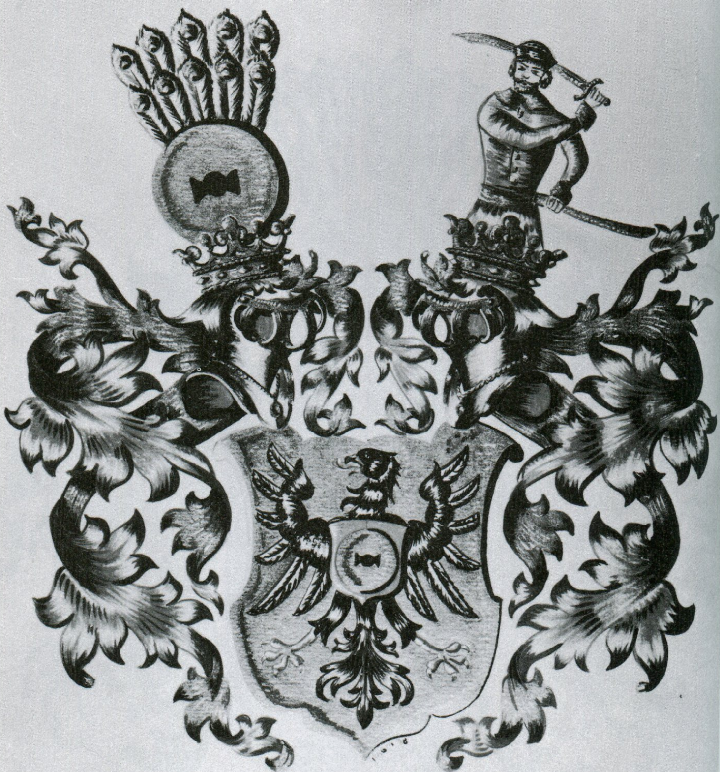
3. Poslední polepšení erbu Vejtšmilarů z roku 1631. Kresba Miroslav Magni.