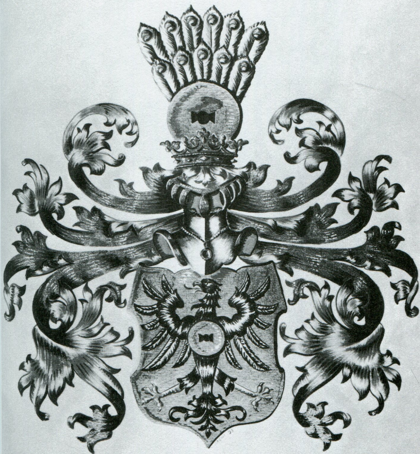
2. Polepšení erbu Vejtmilarů z roku 1628. Kresba Miroslav Magni.