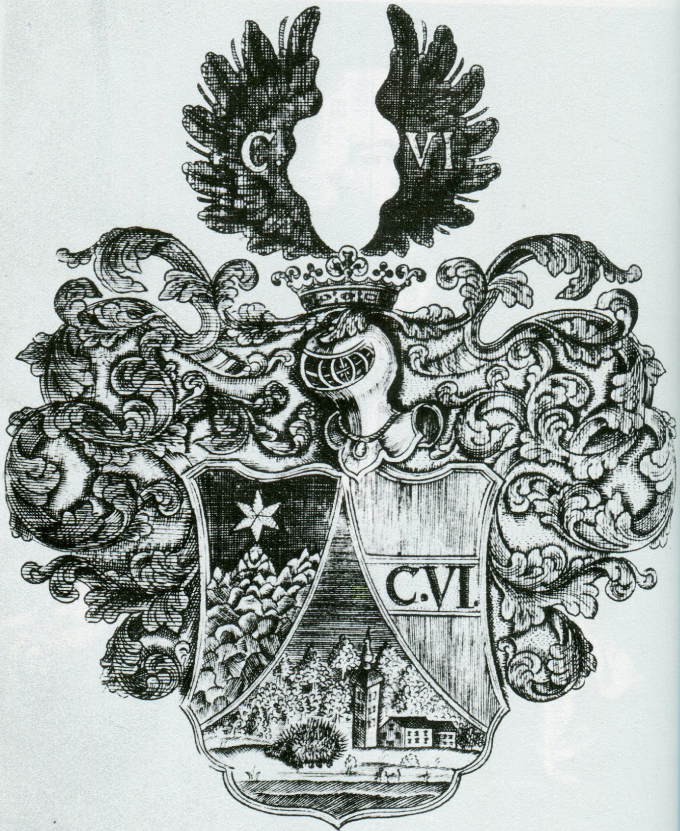
2. Znak Josefa Ignáce Zeba z Breitenau.