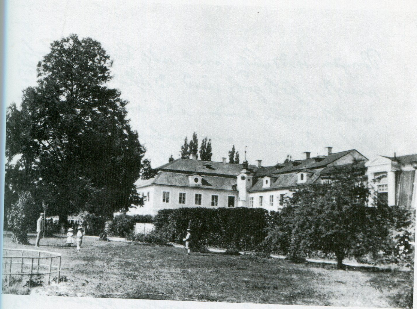
3. Zámek v Plandrech, počátek 20. století.