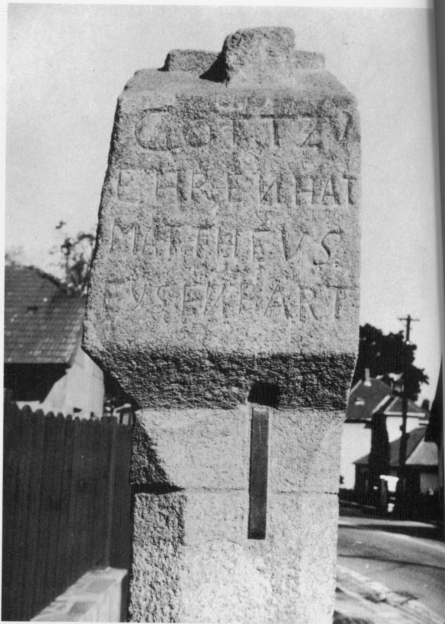
4. Text na levé straně hlavice.