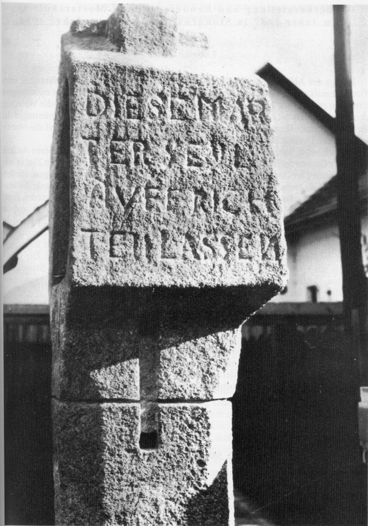
5. Text na pravé straně hlavice.