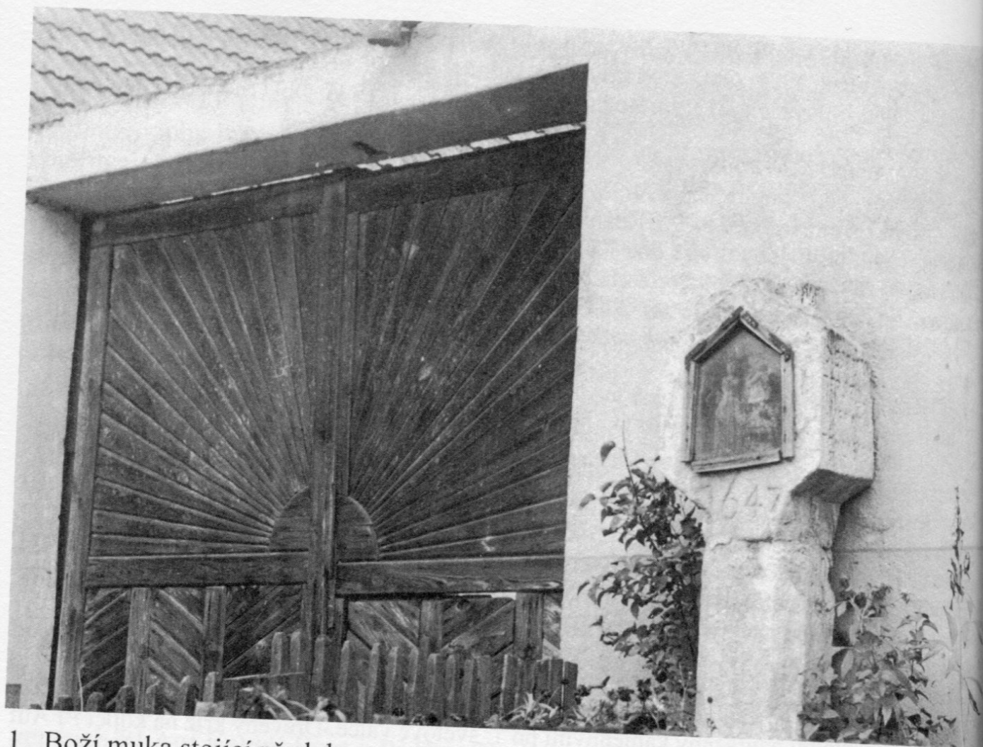
1. Boží muka stojící před domem čp. 3, stav v polovině 60. let.