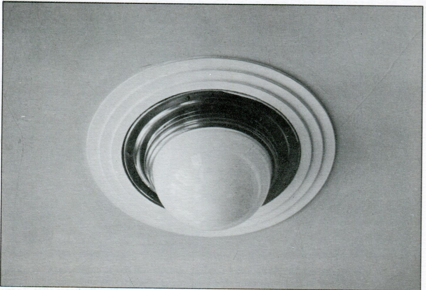
Typické stropní svítidlo v hlavním sále sokolovny.