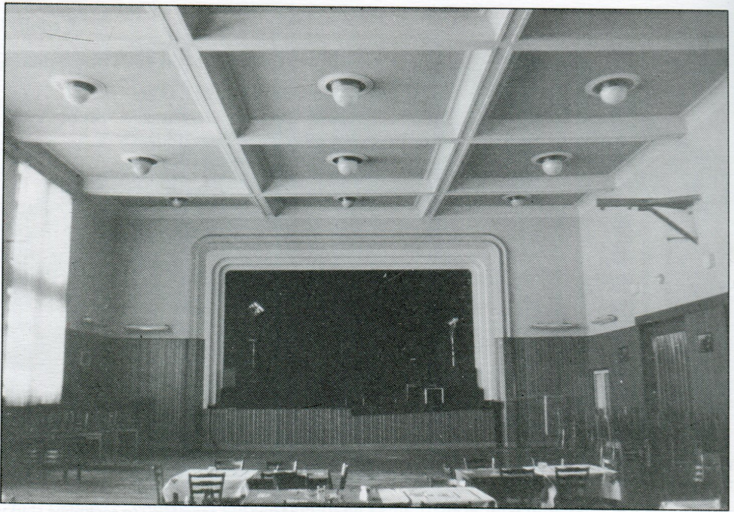
Pohled do východní části hlavního sálu sokolovny s jevištěm.