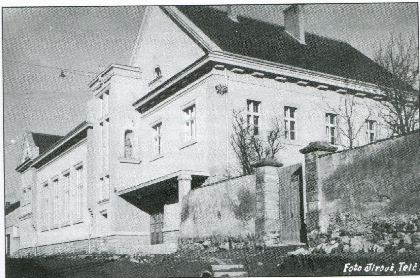
Celkový pohled na Katolický dům s orlovnou z Jihlavské ulice se starší úpravou zahrady.