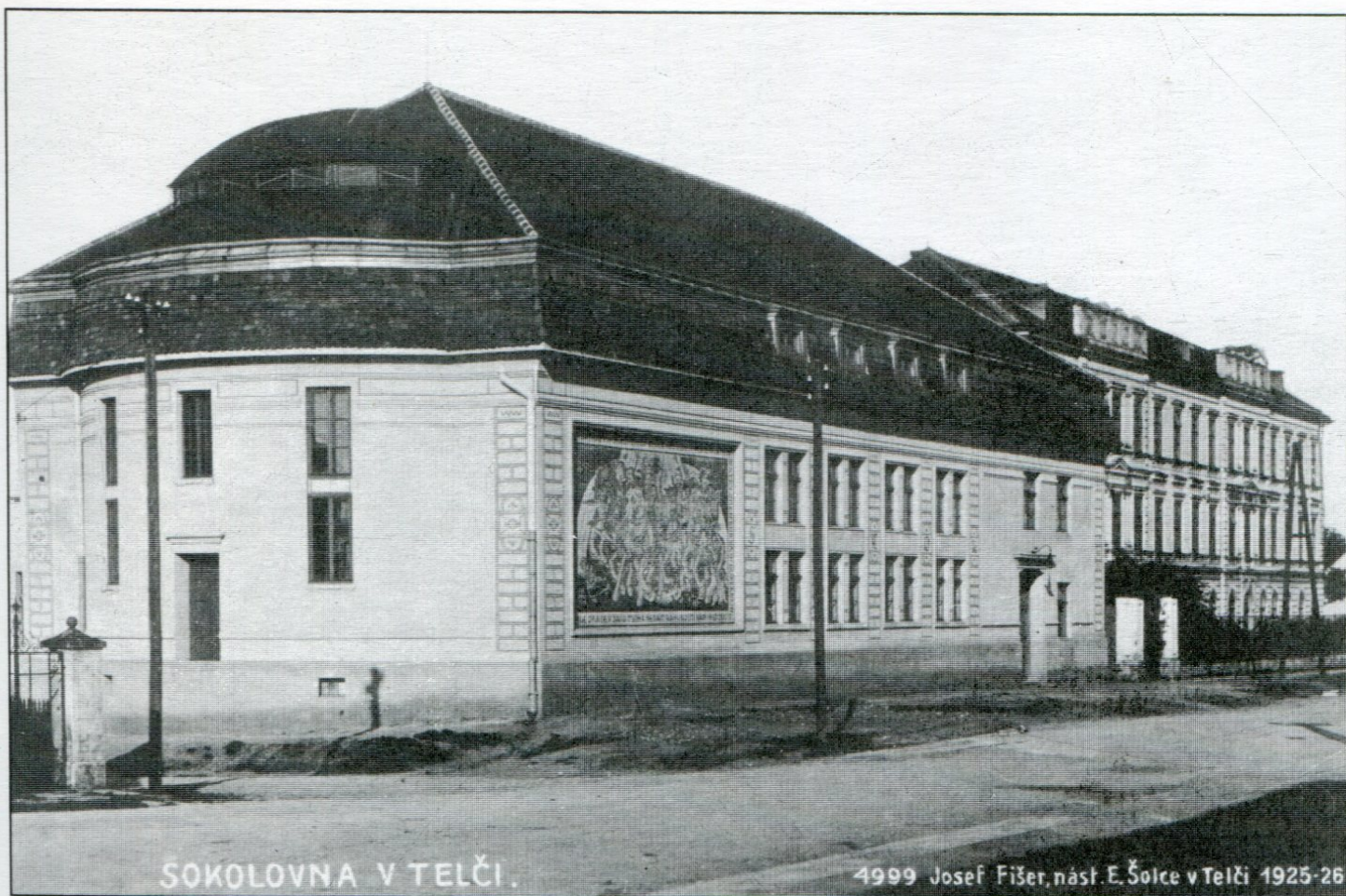
Celkový pohled na sokolovnu od východu z křižovatky pod vlakovým nádražím.