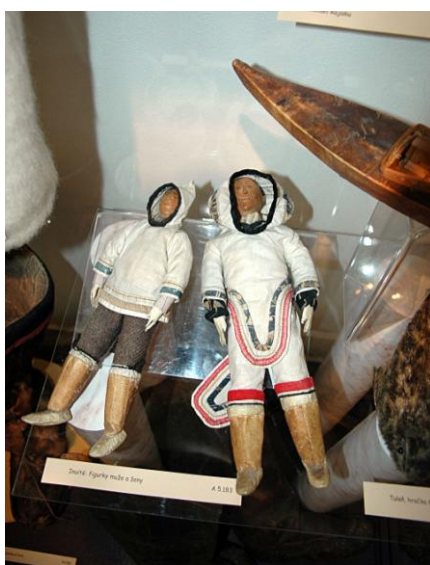
Výstava „Výpravy za posledními lovci a sběrači“