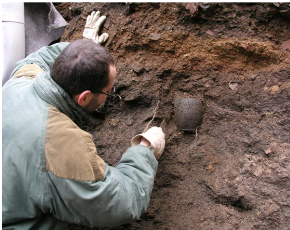
Z archeologického průzkumu ve Smetanově ulici v Jihlavě

Oddělení začalo pracovat od července 2005 a do konce roku provedli jeho pracovníci celkem 43 záchranných archeologických výzkumů. Při nich bylo mj. získáno 1594 kusů nových sbírkových předmětů (přírůstků).