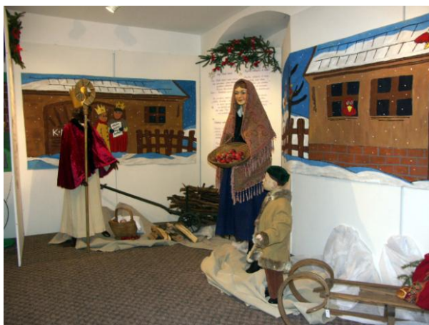
Výstava „ Ó svatá dobo vánoční“