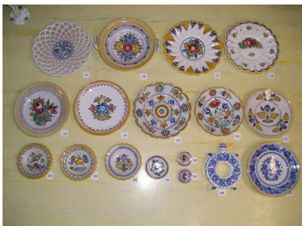
Ukázka ze zakoupeného souboru keramiky