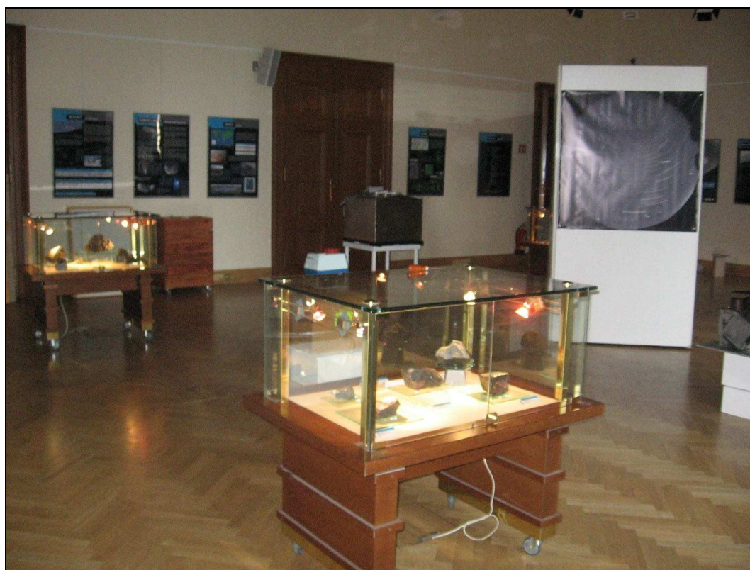
Výstavní prostory, kde byla výstava realizována.

Ve spolupráci s AV ČR byla v prostorách AV na Národní třídě v Praze realizována výstava k výročí pádu příbramských meteoritů (realizace: dr. Malý, Bc. Koišová).