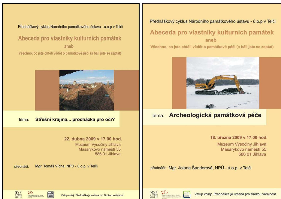
Plakáty na jednotlivé přednášky NPÚ, grafika MVJ.

V roce 2009 proběhlo 7 přednášek pořádaných Národním památkovým ústavem- pobočka Telč. Tento cyklus byl pro veřejnost zcela zdarma a věnoval se problematice staveb v městských památkových zónách (garant Bc. Koišová).