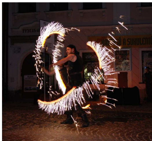
Muzejní noc 13.06. 2009 – vernisáž výstavy Apollo 11, noční ohňová show.