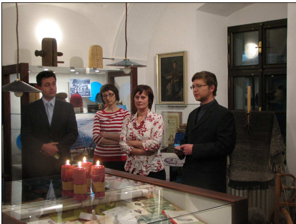
Slavnostní otevření expozice „Zaniklý třeštský průmysl“.