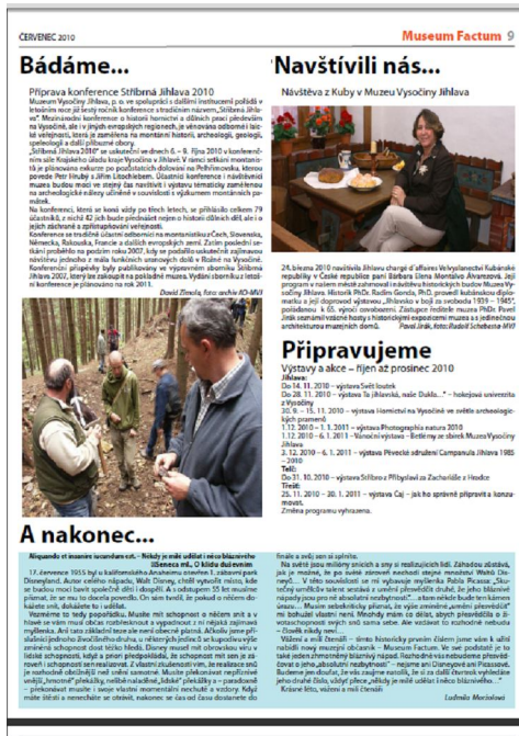
Ukázka muzejního časopisu Museum Factum – číslo I.